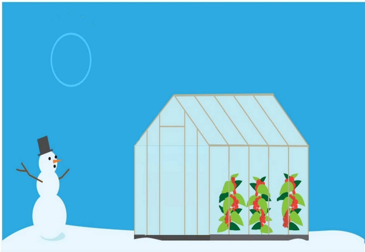
Schaubild „Treibhaus“: ... zum Ausschneiden.