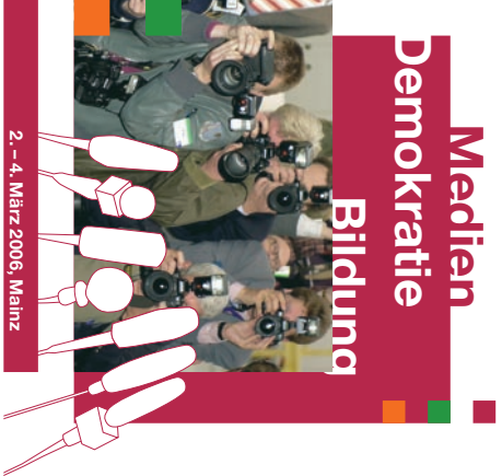
2.-4. März 2006, Mainz