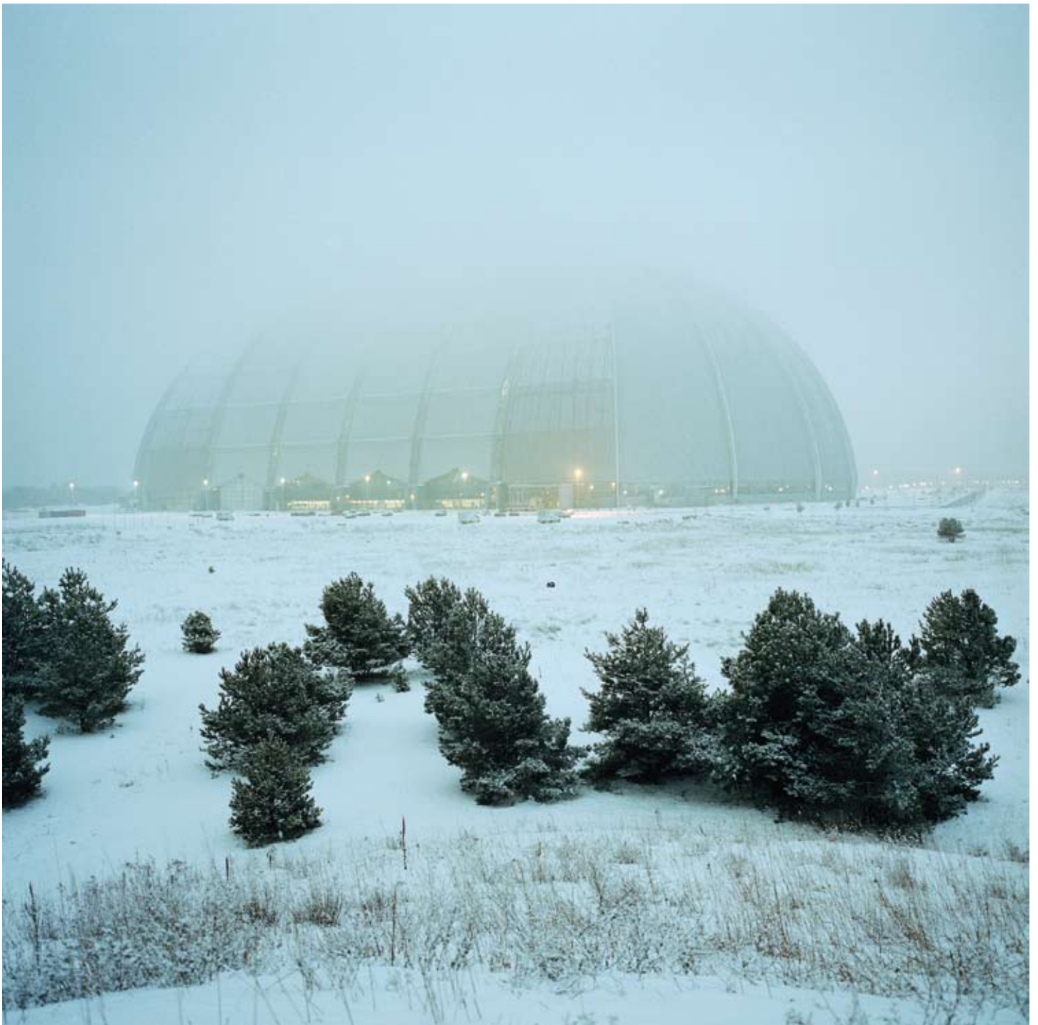
Auferstanden aus Ruinen: Vor ein paar Jahren ging in dieser Halle ein Zeppelin-Hersteller pleite – heute befindet sich darin das Spaßbad Tropical Islands

Heute wird über staatliche Beteiligung an Unternehmen gesprochen – nach 1989 war es umgekehrt: Im Hauruckverfahren wurde die DDR-Wirtschaft abgewickelt Das hat bis heute Folgen