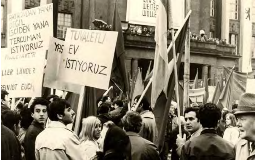
Türkische Gastarbeiter demonstrieren für mehr Dolmetscher und Wohnungen ohne Außentoiletten, vermutlich am 1. Mai 1970.