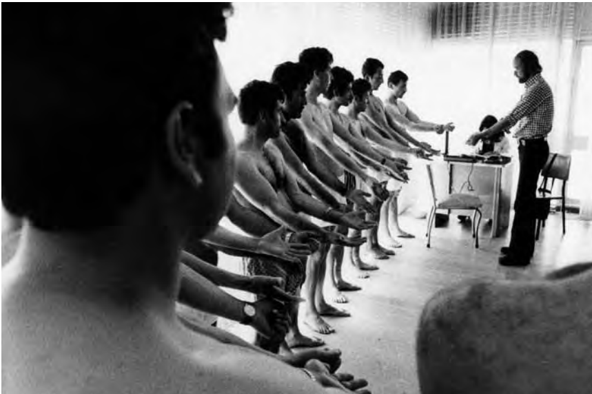
Gesundheitsprüfung in der Deutschen Verbindungsstelle Istanbul, 1973.