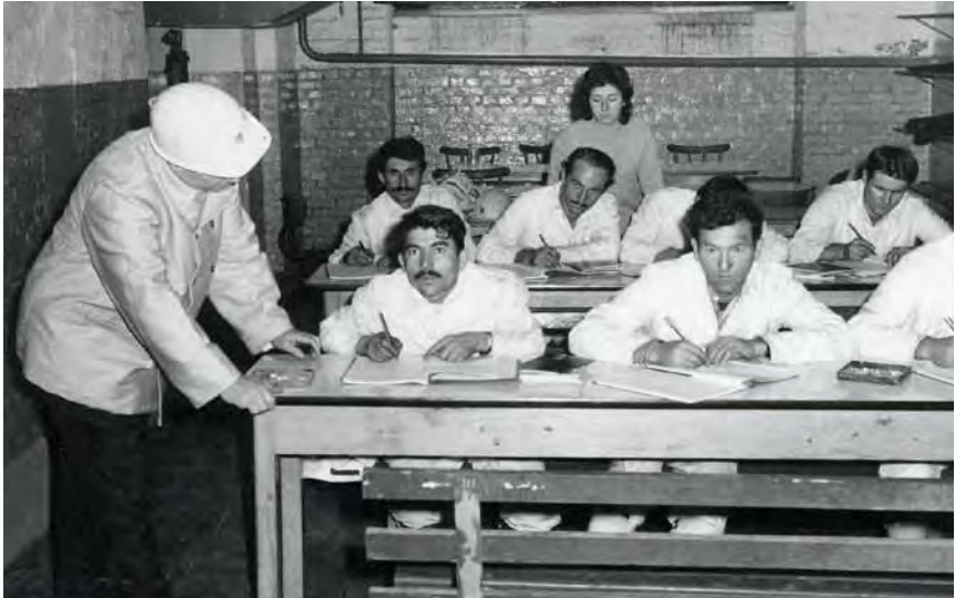
Ein Sprachkurs bei der Ruhrkohle AG, 1971.

setzen. Die Gewerkschaften hatten ebenso erwirkt, dass den Gastarbeitern eine »menschenwürdige Unterbringung« zugesichert wurde. Die Realität sah allerdings am Arbeitsplatz wie in den Wohnvierteln zuweilen anders aus: Immer wieder mussten die ausländischen Arbeitskräfte für das gleiche Geld länger schuften als ihre deutschen Kollegen; viele von ihnen machten auch Überstunden, weil sie in kurzer Zeit so viel Geld wie möglich verdienen wollten. Auch war es keine Seltenheit, dass die Gastarbeiter zu völlig überbeurten Preisen in maroden oder ungepflegten Behausungen wohnten.