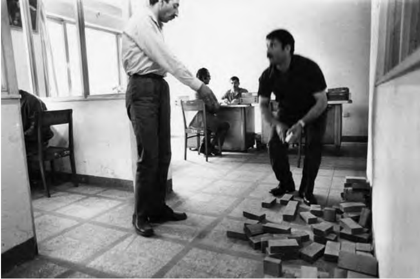
Ein Berufseignungstest in der Deutschen Verbindungsstelle Istanbul, 1973.