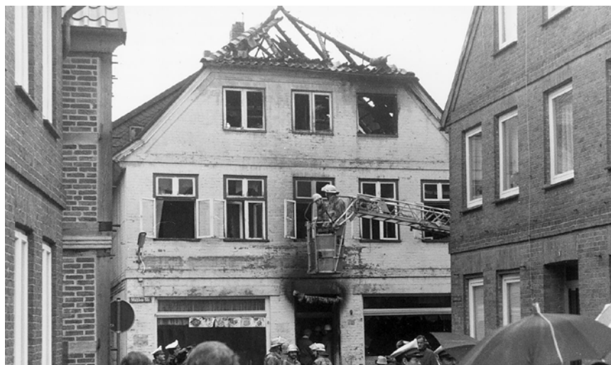
Brandanschlag in der Nacht zum 23. November 1992 auf ein Wohnhaus in Mölln, Schleswig-Holstein, bei dem drei türkische Bewohnerinnen ums Leben kamen.

Auch in den darauffolgenden Jahren ist das Verhältnis von Deutschen und Türken emotionalen Schwankungen und politischen Zäsuren unterworfen. Der Fall der Berliner Mauer 1989 veränderte die politischen und wirtschaftlichen Verhältnisse und damit auch das deutsch-türkische Verhältnis.