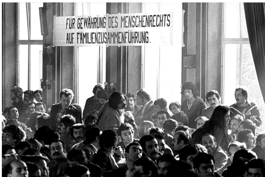
Türkischer Arbeiterkongress in Gelsenkirchen, 1978.

Von den Entlassungswellen in der Regel stärker betroffen als ihre deutschen Kollegen, gründeten viele türkische Einwanderer eigene Unternehmen: Zunächst für die Zielgruppe der eigenen Landsleute; nach und nach aber auch für einen multikulturellen deutschen Markt. Aus den ehemaligen Gastarbeitern oder Leiharbeitern, wie man heute sagen würde, wurden Studierende, Facharbeiter, Künstler, Politiker. Sie gingen eigene Wege, nutzten Chancen und hatten Erfolg. Andere wurden, wie viele Deutsche auch, arbeitslos, hoffnungslos, kriminell. Die Lebensläufe der Gastarbeiter sind so vielfältig wie ihre Motive, nach Deutschland zu kommen. Das verdiente Geld investierten viele in ein Haus in der Türkei. Oder in die Bildung ihrer Kinder – in Deutschland.