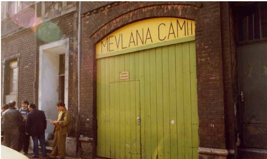
Eine türkische Moschee im Ruhrgebiet.

Anstelle eines wirtschaftlichen Aufschwungs traten in den Jahren nach der Deutschen Einheit 1990 Arbeitslosigkeit und Unzufriedenheit in den Vordergrund. Die Frage, wie das Asylrecht zu regeln sei, löste eine tiefe innenpolitische Krise aus – und verstärkte die Ressentiments gegenüber der nicht-deutschen Bevölkerung. Zwischen 1991 und 1992 kam es in Deutschland zu einer Welle rechtsradikaler Gewalttaten gegen Ausländer. Vorausgegangen waren den Brandanschlägen und Morden in Solingen, Mölln und anderen deutschen Städten hetzerische Kampagnen populistischer Politiker und der Boulevardmedien. Auch wenn viele Deutsche sich in der Folge mit ihren ausländischen Nachbarn solidarisierten, setzte sich die massive Ablehnung durch die deutsche Gesellschaft im kollektiven Gedächtnis der türkischen Einwanderer, aber auch in den Köpfen der Menschen in der Türkei fest.