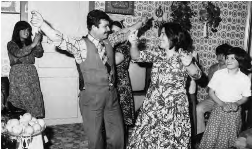
Private Hochzeitsfeier, 1983.

Die Entscheidung, zu bleiben, beschreiben fast alle türkischen Einwanderer als einen mehrere Jahre dauernden Prozess. Häufig endete dieser damit, dass die für die geplante Rückkehr jahrelang in Kellern und Vorratskammern gelagerten Möbel und technischen Geräte aus den Originalverpackungen genommen und in der Wohnung aufgestellt wurden. Ebenso lange brauchte die Bundesregierung, um anzuerkennen, dass Deutschland ein Einwanderungsland geworden war. Wobei auch hier ein wichtiges Instrumentarium über mehrere Jahre gewissermaßen »unausgepackt« vorrätig war: Das sogenannte Kühn-Memorandum aus dem Jahr 1979. Benannt nach seinem Verfasser, dem ersten Ausländerbeauftragten der Bundesregierung, Heinz Kühn (SPD), enthält es wesentliche Grundsätze und Anregungen zur Integration der zugewanderten Bevölkerung in die deutsche Gesellschaft, um Chancengleichheit und ein diskriminierungsfreies Zusammenleben zu gewähren.