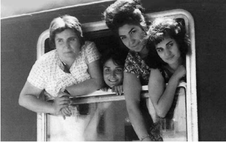
Abschied von der Heimat: Gastarbeiterinnen bei ihrer Abreise in Istanbul.

Diejenigen, die eine Zusage bekommen hatten, stiegen – jedenfalls bis zu Beginn der 70er-Jahre, als immer häufiger auch Flüge von Istanbul nach Deutschland gingen – in den Zug. Bis zu 70 Stunden dauerte die Fahrt vom Bahnhof Istanbul-Sirkeci zum Münchner Hauptbahnhof, wo die Sonderzüge der Gastarbeiter auf dem immer selben Gleis anhielten: Gleis 11. Erschöpft, aufgeregt und gespannt, was das Leben in Deutschland ihnen bringen würde, kamen die Menschen dort an. Kaum einer wusste, wohin die Reise ihn oder sie führen würde, in welcher Stadt oder in welchem Job er oder sie arbeiten würde. Für die allermeisten war es die erste Reise in ein fremdes Land; Deutsch oder Englisch sprachen die wenigsten.