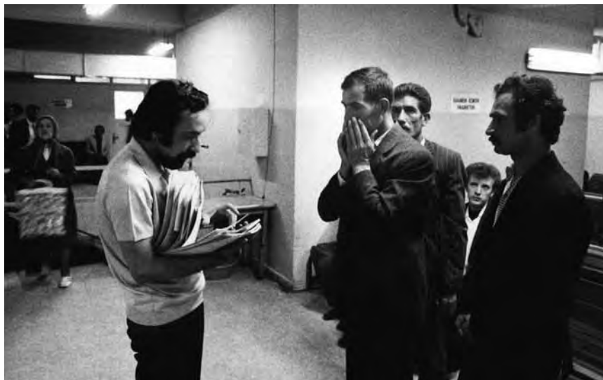
Bestanden oder durchgefallen? Warten auf das Ja oder Nein zur Ausreise, 1973.