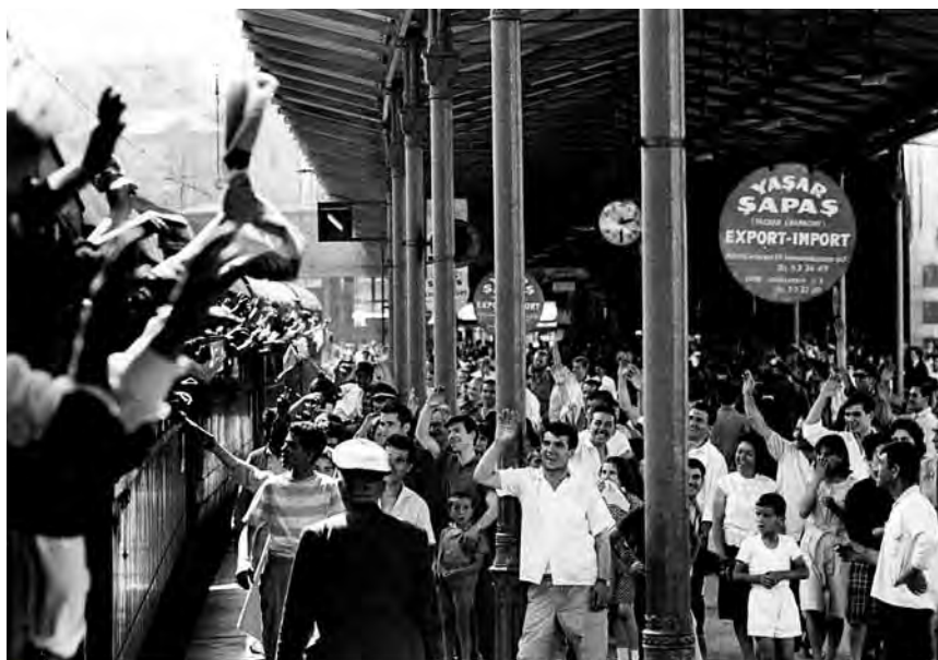
Das Gedränge ist riesig – ein Zug fährt ab von Istanbul nach München, 1969.