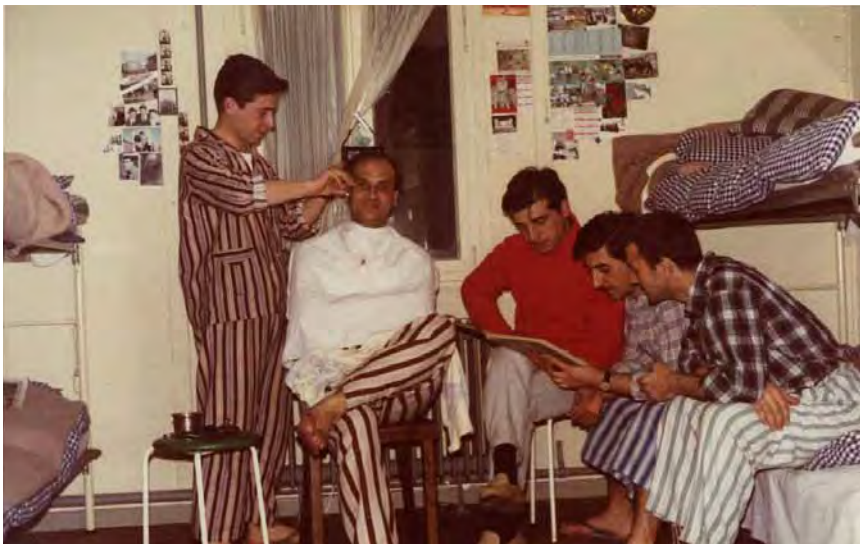
Etagenbetten und Fotos aus der Heimat: Gastarbeiter in einem Wohnheim in Frankfurt am Main, 1965.