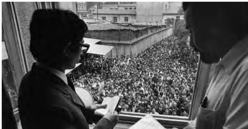
Istanbul: Bewerber vor der Deutschen Verbindungsstelle, der Außenstelle des deutschen Arbeitsamtes, 1972.

und nicht nur die Arbeitgeber – durfte seine neuen Arbeitskräfte im Ausland in einem von ihm geführten Büro selbst auswählen. Sogenannte Deutsche Verbindungsstellen wurden eingerichtet: Nach Rom, Neapel und Verona, Athen und Thessaloniki eröffnete die Bundesanstalt für Arbeit 1961 auch in Istanbul eine Verbindungsstelle.