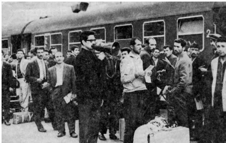
Ankunft der Gastarbeiter auf dem Gleis 11 im Münchner Hauptbahnhof (Foto aus dem Münchner Merkur vom 24. November 1965).

Die mehr als zwei Millionen Gastarbeiterinnen und Gastarbeiter, die zwischen 1955 und 1973 nach Westdeutschland kamen, schraubten nicht nur an den Fließbändern großer Fabriken Fernseher oder Autos zusammen. Sie bauten auch neue Wohnviertel oder legten Gärten an, schwitzten in Hochöfen und Bergwerken, kochten und putzten in Großküchen und Hotels. All das von der Nordseeküste bis an den Tegernsee. Dass die Gastarbeiter auch in beschauliche Dörfer in den Bergen oder am Meer kamen, war dabei nicht selten: In Zeiten, in denen die zu Wohlstand gekommenen Deutschen das Reisen für sich entdeckten, suchte auch die Hotel- und Tourismusbranche in den Kurorten händeringend Personal.