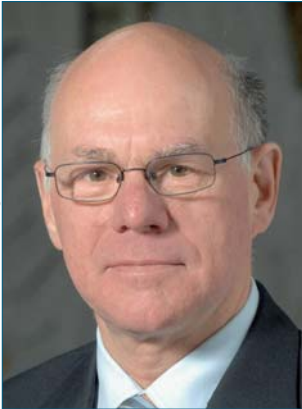
Prof. Dr. Norbert Lammert Präsident des Deutschen Bundestages