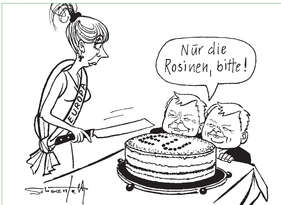
Mit den Kaczynski-Zwillingen am Tisch

und die Europäische Kommission, die gehalten sind, gemeinsame Interessen gegen die nationalen Sonderwünsche zu vertreten. Dieses komplexe Geflecht, überhaupt die Komplexität der europäischen Fragen zu erkennen und nicht von vornherein mit Vorurteilen abzulehnen, ist ein wichtiges Ziel des Unterrichts. Verständnis für die historische Leistung und Problembewusstsein gleichermaßen sollen erreicht werden.