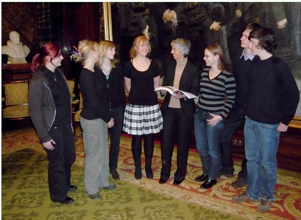
Die Hamburger Senatorin für Bildung und Sport, Alexandra Dinges-Dierig, stellt den ersten Band der Europa Materialien im Dezember 2007 zusammen mit Schülerinnen und Schülern, die daran mitgearbeitet haben, der Öffentlichkeit vor.

den Bundeslandes an (Band 2, Kap 1), und zwar in individualisierter Form oder als Gruppenarbeit. Es folgen Präsentationen der auf das jeweilige Bundesland bezogenen Ergebnisse und Referate zu den Sachgebieten, die in Band 1 und 2 enthalten sind (Basismaterial). Angereichert und aktualisiert werden diese Referate durch Internetrecherchen, die durch die angegebenen Internetadressen und Links erleichtert werden. Ebenso können die Materialien in Band 1 und 2 zum Ausgangspunkt von Jahresarbeiten zu Themen der Europäischen Union gemacht werden.