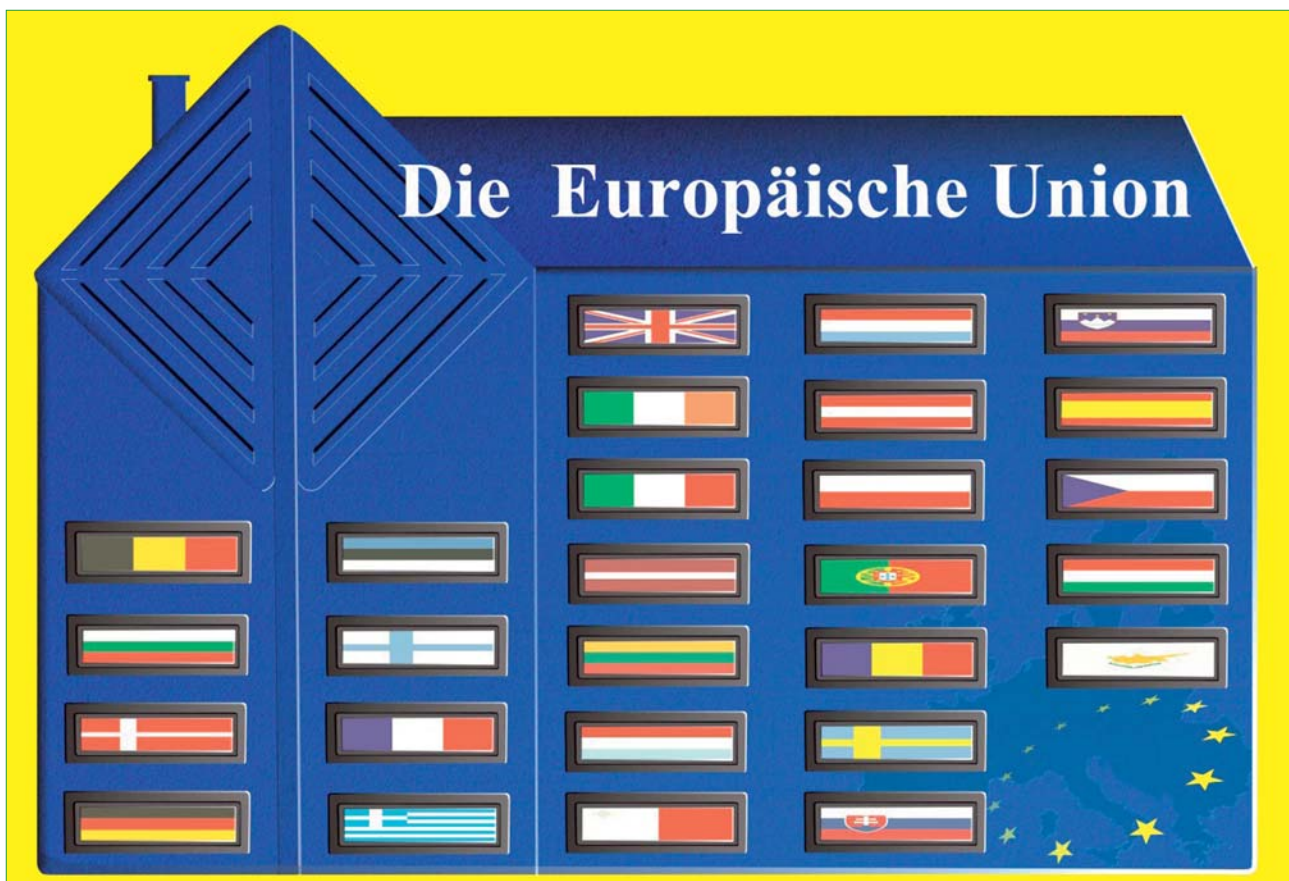
Das Haus der Europäischen Union