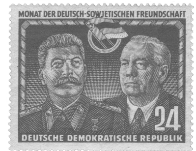
— Abb.: Briefmarke aus dem Jahr 1951 mit Stalin (links) und Pieck (rechts)

— Tipp: Mehr dazu: www.bpb.de/shop > Infos zur pol. Bildung > Geschichte der DDR > Der Ausbau des neuen Systems