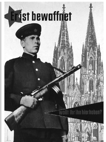
— Abb.: Plakat der CDU aus dem Jahr 1953

Adenauer konnte für seine Politik in freien Wahlen Mehrheiten bei den Westdeutschen gewinnen. Bei der Bundestagswahl am 6.9.1953 erhielten diejenigen Parteien eine ⅔ Mehrheit, die seinen Kurs der Westintegration und der Wiederbewaffnung unterstützten.