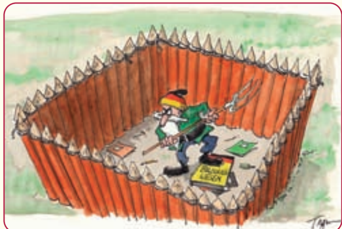
Thomas Plafmann/Baaske Cartoon