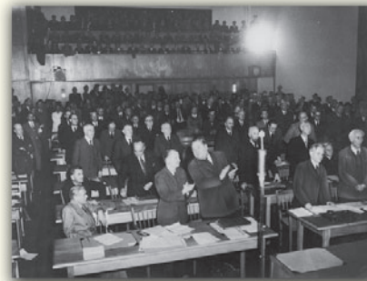
(Originalzitate in alter Rechtschreibung)