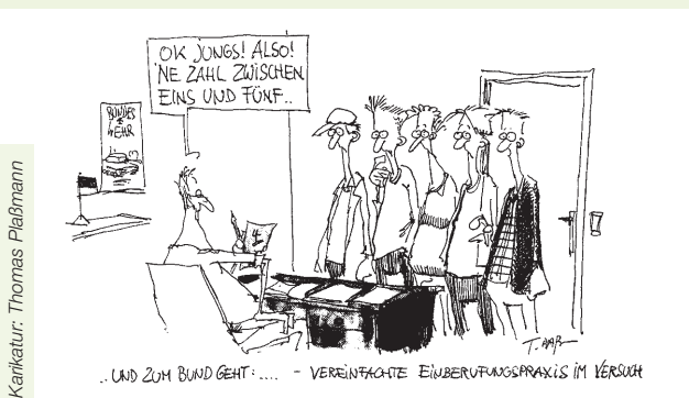
Karikatur: Thomas Pleßmann

→ Wie wird nach Darstellung des Zeichners über die Einberufung entschieden? Was will er kritisieren?