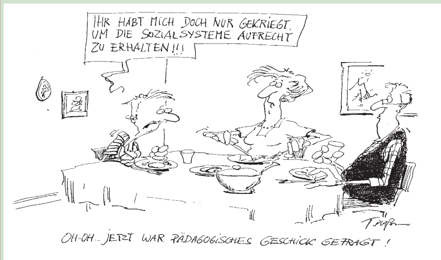
Karikatur: Thomas Plafmann

Zunächst bereiten die Schüler und Schülerinnen in zwei getrennten Gruppen das Streitgespräch vor. Es beginnt mit jeweils zwei Personen auf der „Eltern“- und der „Kinder“-Seite. Um möglichst viele Schüler und Schülerinnen zu beteiligen, wird mit Loskärtchen (auf denen – nach den beiden Gruppen getrennt – die Namen aller beteiligten Schüler und Schülerinnen stehen) ein „fliegender Wechsel“ eingebaut: Nach einer festgelegten Zeit zieht die Lehrperson jeweils zwei neue Namen aus dem Stapel der „Kinder“- und der „Eltern“-Gruppe. Diese neuen Personen nehmen nun die Plätze der ursprünglichen Kinder und Eltern ein und spielen weiter.