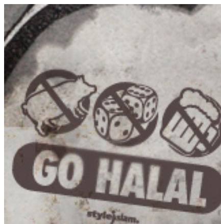
„Go halal – entscheide Dich für das Erlaubte!“ ist eines der T-Shirt-Motive, die Styleislam anbietet...

Denffer zeigt damit, dass er - wie viele Muslime (und Nichtmuslime) - unter Demokratie vor allem das Prinzip versteht, wonach allein der Wille der Mehrheit ausschlaggebend sei. Das Bestehen und die Bedeutung unveräußerlicher Grundrechte