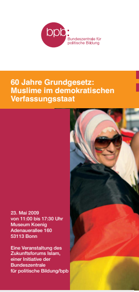
Flyer zur Veranstaltung Muslime und der demokratische Verfassungsstaat der Bundeszentrale für politische Bildung

Leiter des Islamischen Zentrums Hamburg , auf Cicero-Online . Lesenswert zu den Themen Grundgesetz und Wertordnung in der politischen Bildungsarbeit ist die Informationsschrift von Joachim