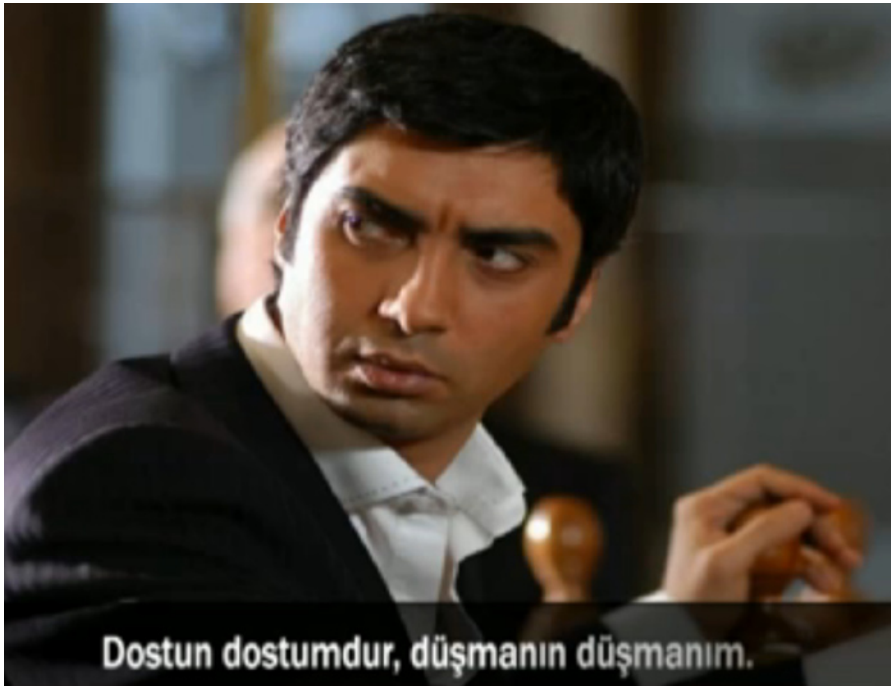
„Dein Freund ist mein Freund, dein Feind ist mein Feind.“ Neue Staffel der Serie Tal der Wölfe

Die TV-Serie Tal der Wölfe ist in der Türkei und unter deutsch-türkischen Jugendlichen sehr beliebt. Denn auch in der neuen Staffel ist der Held eine Identifikationsfigur, die für Ehre und Stärke steht – die des Mannes und der Nation.