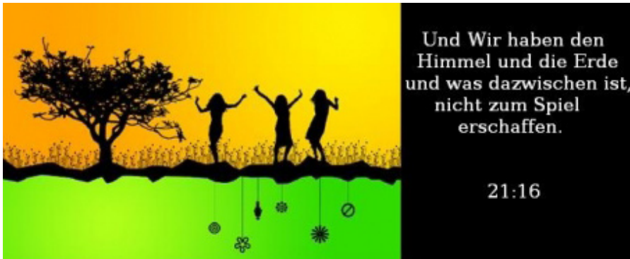
Posting auf Waymo, dem Multimedia-Portal des Zentralrats der Muslime in Deutschland

sie kein Kopftuch trügen, Allah offensichtlich nicht lieben würden – und wer Allah nicht liebt, den könne Allah natürlich auch nicht lieben. Die „lieben Schwestern“, so heißt es in dem Video, wüssten doch nur zu gut, was die „islamische Kleiderordnung“ von ihnen verlange. Sie kämen nicht ins Paradies, wenn sie Allahs Willen nicht gehorchten.