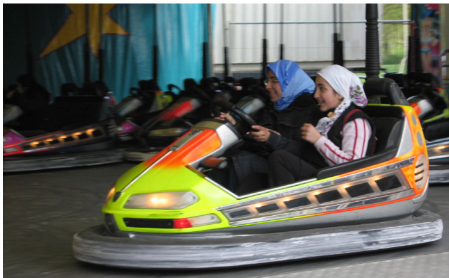
Im Alltag stellt sich religiösen Jugendlichen oft die Frage, ob ein bestimmtes Verhalten mit dem Islam vereinbar ist. Amüsieren kann man sich aber trotzdem.

Muslima-aktiv.de unterscheidet sich von anderen islamischen Foren durch die Offenheit, in der die Diskussionen geführt werden. Zwar werden auch hier teilweise sehr konservative Ansichten vertreten, doch geht es den Teilnehmerinnen vielfach zunächst darum, einen Ausgleich zwischen religiösen Ansprüchen und Geboten und den alltäglichen Erfordernissen zu finden. Im Mittelpunkt steht die Lösung von Fragen und Konflikten, die einem als explizit religiösen Menschen begegnen können. Die islamischen Quellen erscheinen dabei eher als Leitbild denn als starres Regelwerk, dem sich der oder die Einzelne bedingungslos unterzuordnen habe. ■