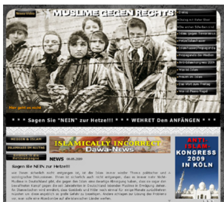
Salafitische Gruppierungen instrumentalisieren den Holocaust und nutzen antirassistische Proteste für ihre Ziele: die Internetseite Muslimegegenrechts

Auch der Macher dieses Videos spricht muslimische Mädchen und junge Frauen direkt an und behauptet, dass diese, wenn