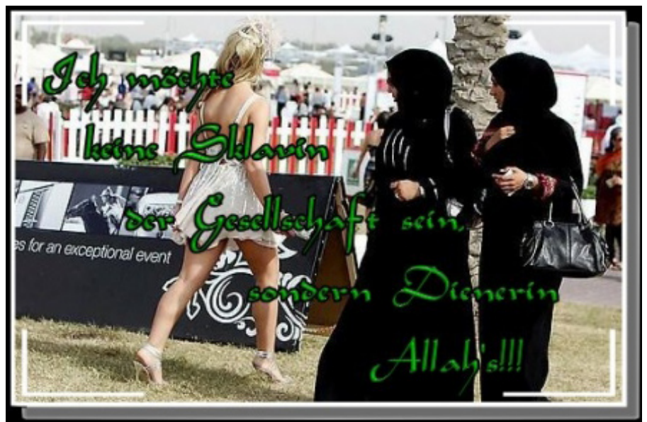
„Keine Sklavin der Gesellschaft“ – Posting auf Waymo

Im Weiteren entwickelte sich eine Diskussion darüber, welche Werte denn eigentlich hinter bestehenden Regeln und Normen zu Sexualität oder zum Kopftuchgebot stehen. Ohne dass diese Normen dabei grundsätzlich infrage gestellt wurden, begannen die Jugendlichen, sich mit ihnen auseinanderzusetzen und die eigene Haltung und das eigene Verhalten zu überprüfen. Dabei wurden durchaus unterschiedliche Positionen deutlich. Begünstigt werden solche Auseinandersetzungen durch Themen, die direkt an den Alltag der Jugendlichen anknüpfen. Nicht weniger wichtig war allerdings das Gesprächsklima: Erst als die Jugendlichen den Eindruck hatten, dass es nicht darum geht, „den Islam“ zu kritisieren, verließen sie die Defensive und ließen sich auf eine Diskussion ein, in der es auch um ihre Überzeugungen ging. ■