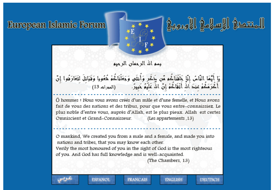
Website des Europäischen-Islamischen Forums

Dabei fällt auf, dass es nicht zuletzt Organisationen aus dem konservativen und islamistischen Spektrum sind, die eine