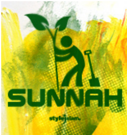
... ein anderes heißt: „Sunnah – so wie es der Prophet tat!“