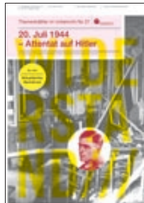
20. Juli 1944 – Attentat auf Hitler (Nr. 37)