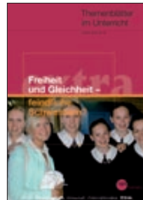
Freiheit und Gleichheit – feindliche Schwestern? (Nr. 40)