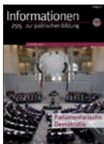
Parlamentarische Demokratie (Nr. 295)