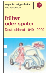
„früher oder später“ – das Kartenspiel zu pocket zeitgeschichte Autor: Bernhard Weber (Bestell-Nr. 1.921)