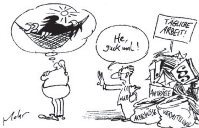
— Zeichnung: Burkhard Mohr