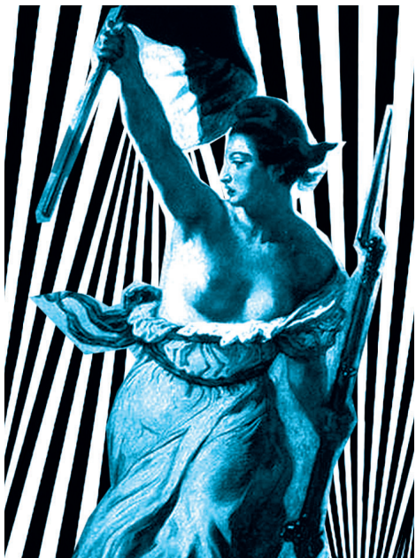
Ausschnitt aus Die Freiheit führt das Volk an von Eugène Delacroix

reich eine konstitutionelle. Die Nationalversammlung schafft die feudalen Privilegien ab und verkündet am 26. August 1789 die Erklärung der Menschen- und Bürgerrechte . Dort heißt es in Artikel 1: „Die Menschen sind und bleiben von Geburt frei und gleich an Rechten.“ Gleichheit meint hier also Gleichberechtigung. 1791 wird eine neue Verfassung verabschiedet. Danach basiert der französische Staat auf den Prinzipien der Freiheit, Gleichheit und Brüderlichkeit. Die Gleichheit meint die Gleichheit aller Bürger