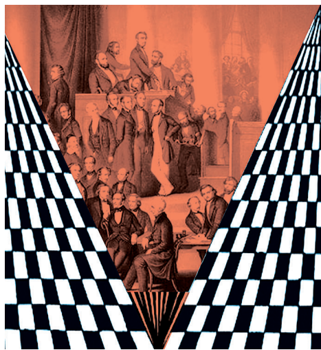
Verfassunggebende Versammlung, Paulskirche

Nach dem Vorbild der amerikanischen Unabhängigkeits- und der französischen Menschenrechtserklärung findet im 19. Jahrhundert das Gleichheitsprinzip Eingang in eine deutsche Verfassung: Am 27. Dezember 1848