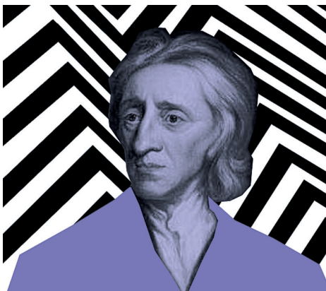
John Locke, englischer Philosoph

Im christlichen Mittelalter klaffen philosophische Theorie und politische Praxis immer noch auseinander. Zwar gibt es Persönlichkeiten wie den Kirchenmann und Philosophen Nikolaus von Kues (1401–1464), der die Menschen von Natur aus als „gleich mächtig“ und „gleich frei“ ansieht. Auch wird die Würde des Menschen aufgrund der im Christentum postulierten Gottesebenbildlichkeit gestärkt. Andersgläubige sind davon jedoch ausgeklammert. Die Ständegesellschaft