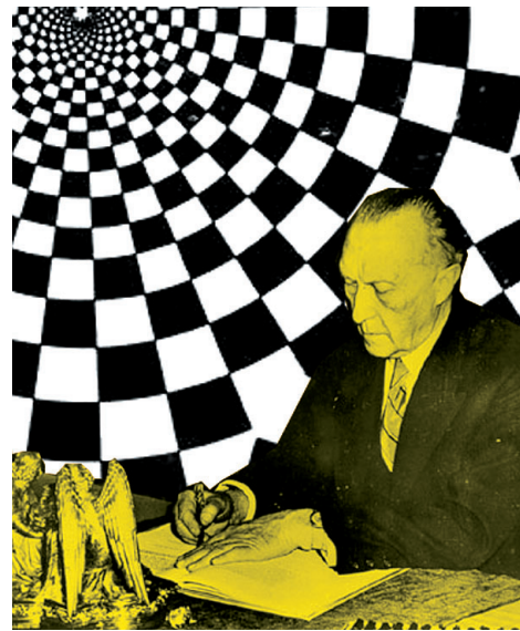
Konrad Adenauer, erster Bundeskanzler

Die Erfahrungen des Dritten Reiches , während dessen die Grundrechte 1933 durch das Ermächtigungsgesetz ausgesetzt worden waren, haben große Bedeutung für das Grundgesetz von 1949 und die Verankerung der Grund- und Menschenrechte. Diese stehen seither am Beginn der Verfassung, sind die Grundlage der Bundesrepublik Deutschland und unmittelbar bindendes Recht. Art. 3, Abs. 1 schreibt vor: „Alle Menschen sind vor dem