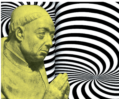
Nikolaus von Kues

aller gelten. Konkreten politischen Einfluss haben diese Ideen allerdings nicht.