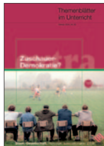
Zuschauer - Demokratie? (Nr. 39) nur noch online