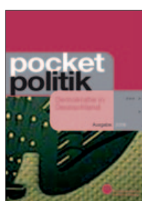
pocket politik – Demokratie in Deutschland (Bestell-Nr. 2.551) 1,- Euro