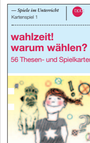
wahlzeit! warum wählen? – Kartenspiele im Unterricht (Bestell-Nr. 1.922) 1,- Euro

56 liebevoll illustrierte Thesenkarten, mit denen man Quartett oder Schwarzer Peter spielen, aber auch heftige Gruppendiskussionen auslösen kann.