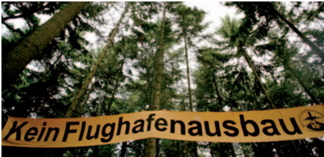
Abb 1.: Protest gegen den Frankfurter Flughafen-Ausbau – Waldcamp Kelsterbach

..... Was hat der Ausbau eines Flughafens mit Demokratie zu tun? Hemmen demokratische Spielregeln die wirtschaftliche Entwicklung?