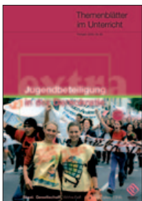
Jugendbeteiligung in der Demokratie (Nr. 38) nur noch online