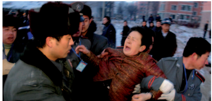
Abb. 2: Zwangesräumung in Changun /China wegen eines Wohnbauprojekts

"Seit 1998 streiten Politiker, Anwohner und Wirtschaft über die Erweiterungspläne [des Frankfurter Flughafens], allein in der ersten Runde wurden über 127 000 Einwendungen geprüft. (...)