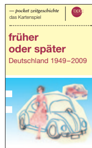
früher oder später – das Kartenspiel zu pocket zeitgeschichte (Bestell-Nr. 1.921) 1,- Euro