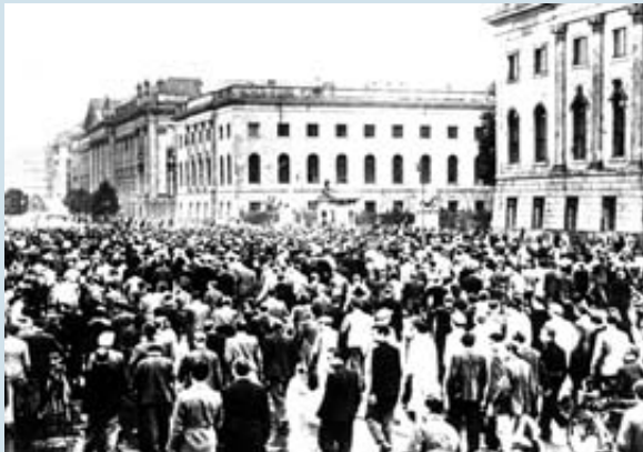
Berlin, Unter den Linden