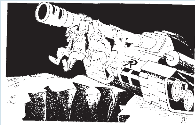
Zeichnung: Josef Partykiewicz 1953