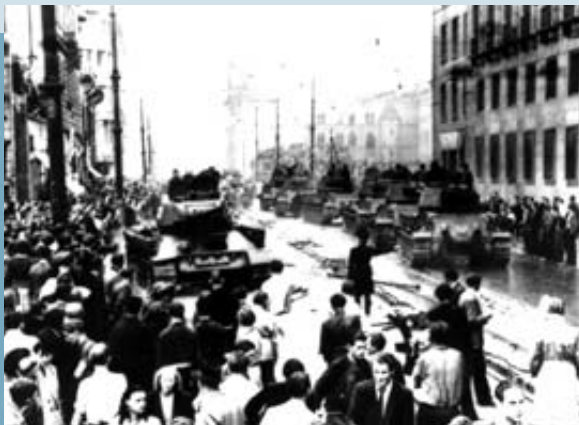
Berlin, Leipziger Straße: Russische Panzer vor dem Haus der DDR-Ministerien, heute Bundesfinanzministerium (Bundesarchiv, Koblenz).