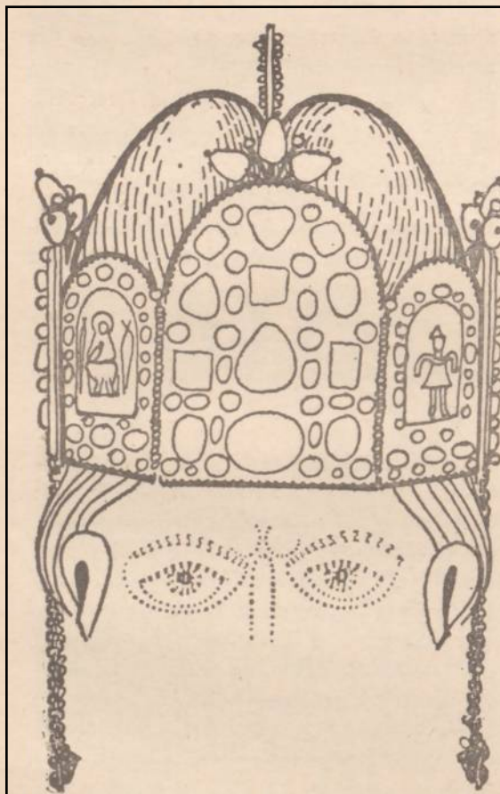
Abb. 2: Die „Reichskrone“ mit Mitra (deren Kontur entnommen der Darstellung eines Regensburger Bischofs in hohenpriesterlicher Gewandung im Uta-Codex, Anfang des 11. Jahrhunderts).

Ist die Krone wirklich so alt? Auf ihrem Bügel steht der Name Konrads II., aber es läßt sich zeigen, daß er einen älteren, gleichgeformten ersetzt hat. Der Vergleich der originalen acht Platten mit anderen Goldschmiedearbeiten der Zeit, den Hermann Fillitz durchführte, kam zu dem Ergebnis, daß der Kronreif bereits mit den ältesten Werken des Essener Domschatzes korrespondiert, also bis mindestens in die Jahre um 970 heraufdatiert werden muß. Da aus den fünfziger und sechziger Jahren Arbeiten ähnlicher Qualität leider fehlen, ist es nicht möglich, nur auf kunsthistorischem Wege zu einer noch genaueren Datierung zu gelangen: jeden-