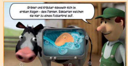
Die vielen Kuhmägen