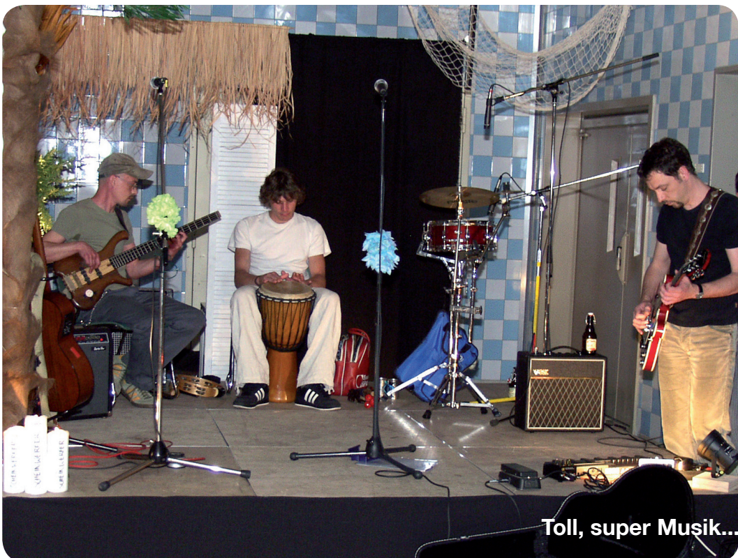
Toll, super Musik...