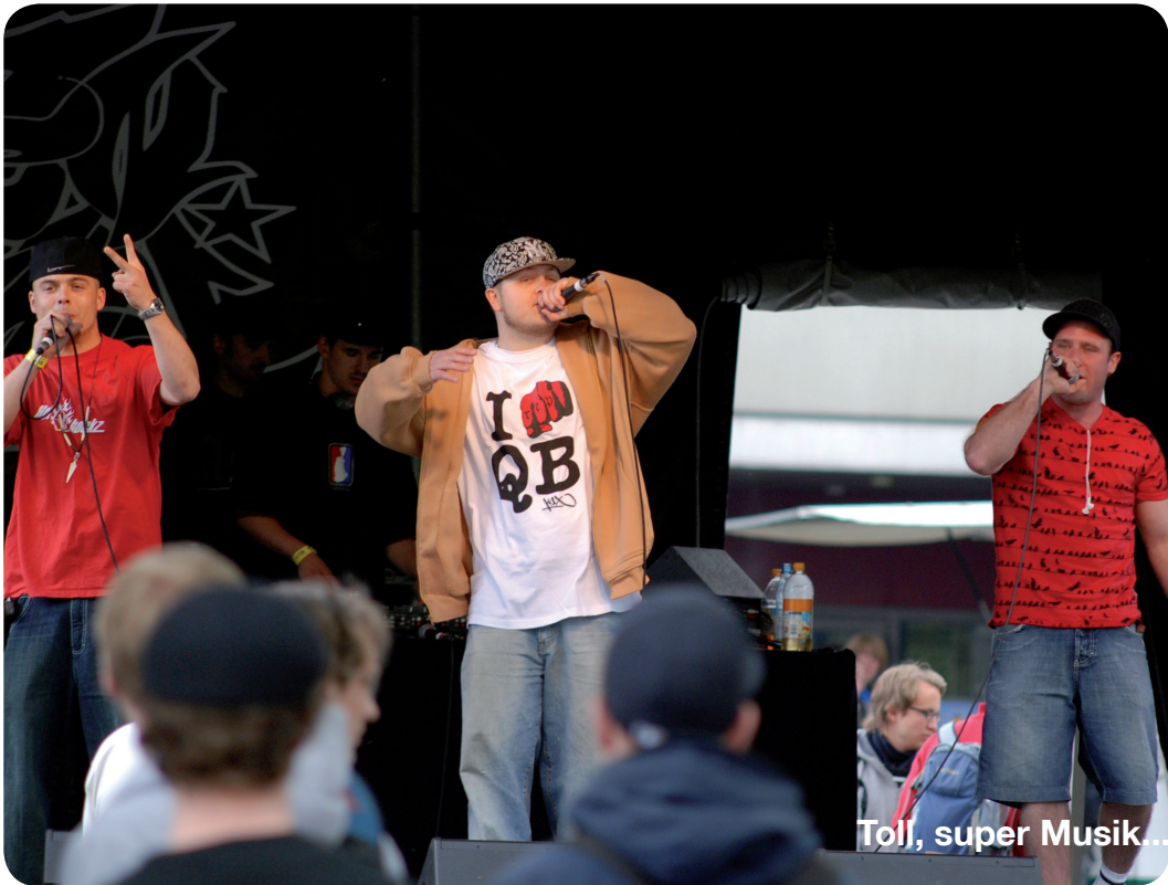
Toll, super Musik...