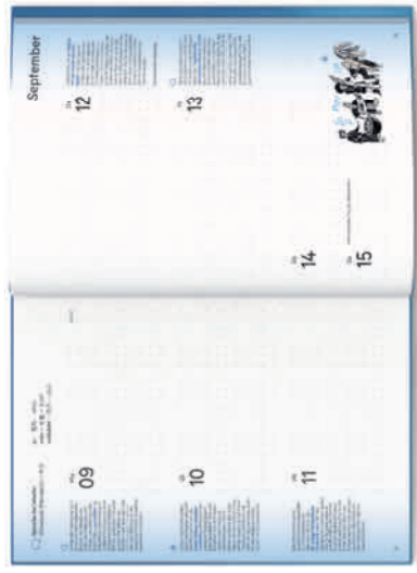
Hardcover „Formen“ Bestell-Nr. 2550 B