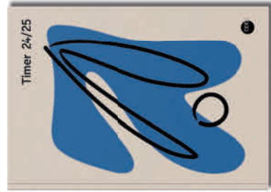
Softcover „Formen“ Bestell-Nr. 2550