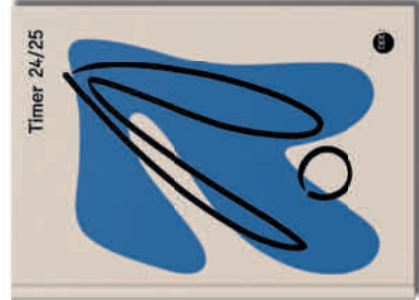
Hardcover „Formen“ Bestell-Nr. 2549

Blau: bundesweite gesetzliche Feiertage. Blau mit * : länderspezifische gesetzliche Feiertage. Schwarz: weitere besondere Daten