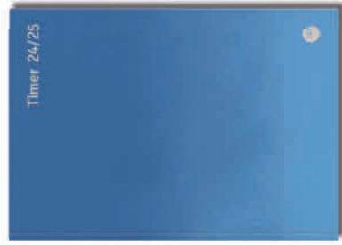
Softcover „Formen“ Bestell-Nr. 2550 B