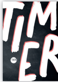
„Große Schrift“ – 2550