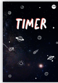
„Weltraum Neonrot“ – 2550B