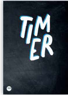
Hardcover „Kleine Schrift“ Bestell-Nr. 2549