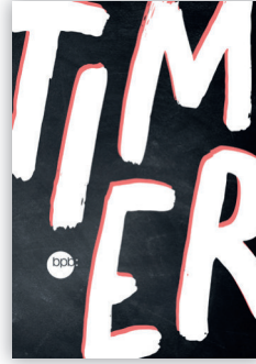
Softcover „Große Schrift“ Bestell-Nr. 2550