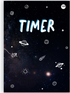
Hardcover „Weltraum Blau“ Bestell-Nr. 2549A