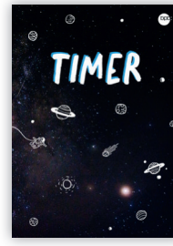
„Weltraum Blau“ – 2549A