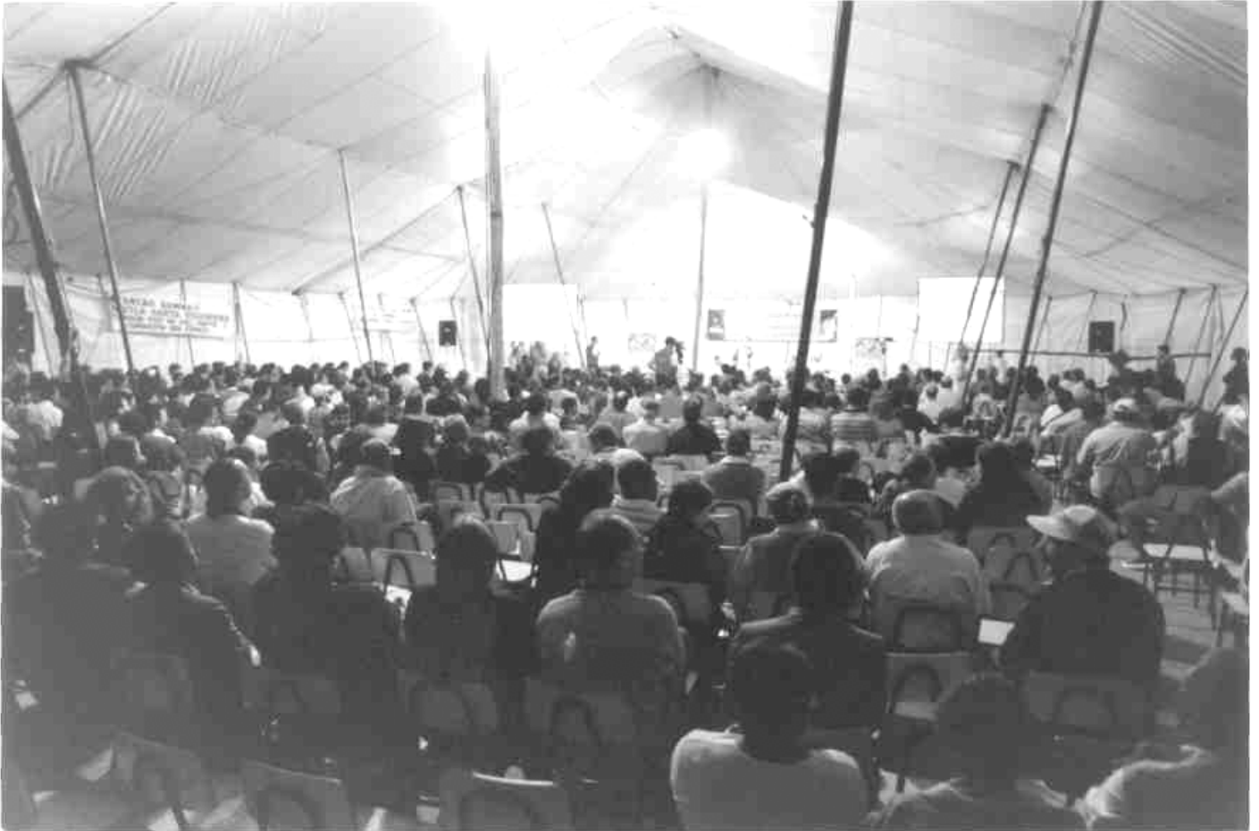
Bild einer Versammlung zum Beteiligungshaushalt in Porto Alegre