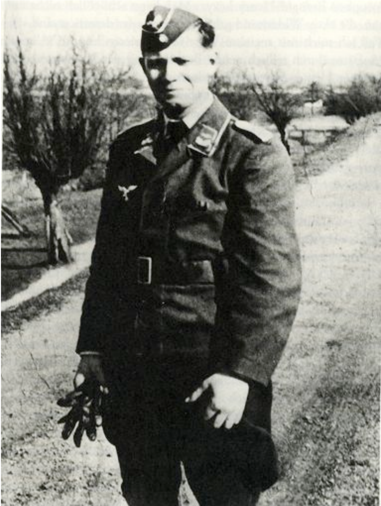
Das Foto zeigt Helmut Schmidt als Leutnant der Luftwaffe an der Ostfront, vermutlich im Herbst 1941. Der Bundeskanzler a. D. bezeichnete in seinen Erinnerungen die