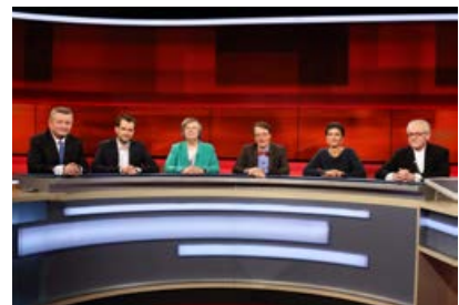
— Abb. 2: Politiker in der Talkshow „hart aber fair“