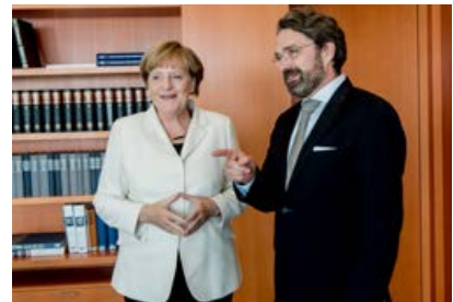
— Abb. 1: Bundeskanzlerin Angela Merkel im Hintergrundgespräch mit dem Deutschlandradio-Chefkorrespondent Stephan Detjen

♀ steht für die weibliche Form des vorangegangenen Begriffs