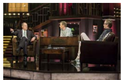
— Abb. 4: Der SPD-Politiker Peer Steinbrück in der Spielshow „Circus Halligalli“