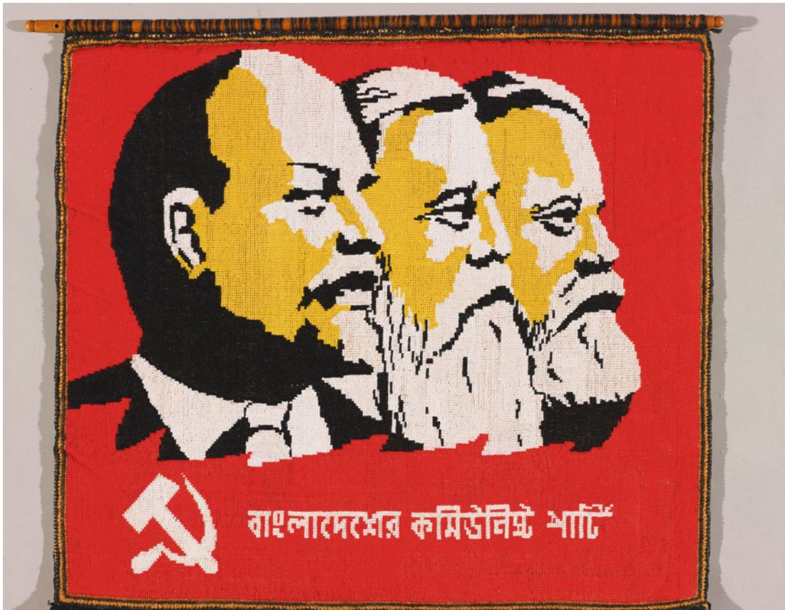
Abbildung 3: Wandteppich mit Porträts von Marx, Engels und Lenin, Bangladesch, vermutlich 1974