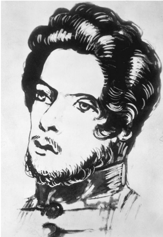
Abbildung 2: Karl Marx als Student, Zeichnung um 1836

erst ab 1844, als Marx sich im Ausland aufhielt. Sie fallen damit in eine Zeit, als er bereits eine öffentliche Person geworden war.