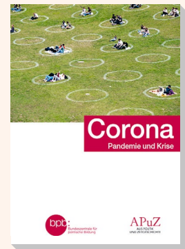
2021 Bestell-Nr. 10714

Hier bestellen oder kostenfrei herunterladen