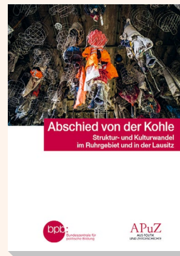
2021 Bestell-Nr. 10751