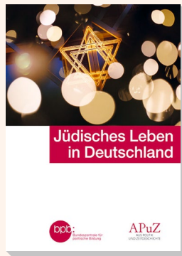
2022 Bestell-Nr. 10799