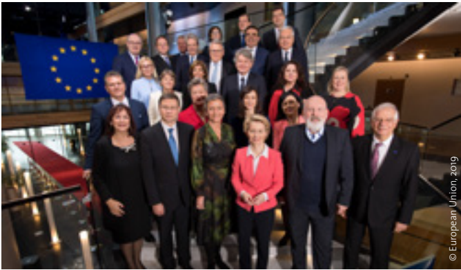
Die neue EU-Kommission unter Ursula von der Leyen im November 2019. Die Verhandlungen über ihre Gesetzesinitiativen moderiert die amtierende Ratspräsidentschaft.

kationsformen stützen und auswählen, welche Treffen physisch, per Videokonferenz oder gar nicht stattfinden sollen.