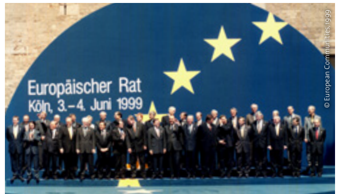
Ein Rückblick: Auf ihrem Gipfel in Köln im Juni 1999 erklären die Regierungschefs und die Spitzen der EU unter anderem ihre Bereitschaft „zur Stärkung der gemeinsamen europäischen Sicherheits- und Verteidigungspolitik“.

Der deutsche Ratsvorsitz 1999 war ebenfalls geprägt von wichtigen Integrationsschritten: der Vertrag von Amsterdam trat in Kraft, mit den mittel- und osteuropäischen Staaten wurden Beitrittsverhandlungen geführt und die Einführung des Euro wurde vorbereitet. Großes Gewicht legte die deutsche Ratspräsidentschaft auch auf die Verabschiedung der sogenannten Agenda 2000, eines umfassenden Aktions- und Reformprogramms, das die EU-Gemeinschaftspolitik mit Blick auf die EU-Erweiterung stärken sollte. Auch 1999 war die Präsidentschaft innenpolitisch eine Premiere, nämlich die der ersten rot-grünen Regierung nach der „Ära Kohl“, der Regierungszeit von Bundeskanzler Helmut Kohl von 1982 bis 1998. Unter dem Eindruck der Kriege auf dem Westbalkan begründete die EU 1999 die „Europäische Sicherheits- und Verteidigungspoli-