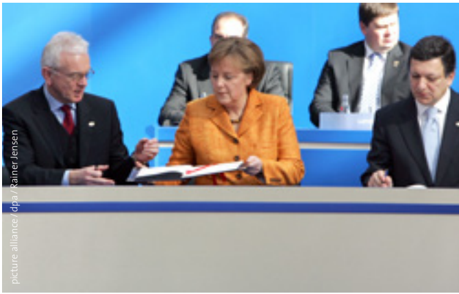
Am 25. März 2007 unterzeichnen Bundeskanzlerin Angela Merkel, der damalige EU-Parlamentspräsident Hans-Gert Pöttering (li.) und der damalige EU-Kommissionspräsident Jose Manuel Barroso die Berliner Erklärung, die die Europäische Idee bekräftigt.

Der Vertrag von Lissabon stellte gleichzeitig einen Höhepunkt in der historischen Entwicklung der Ratspräsidentschaft dar. Ab da übernahm der ständige Präsident im Europäischen Rat die Leitung des politisch hochrangigsten EU-Gremiums, der Hohe Vertreter erhielt den Vorsitz im Außenministerrat. Seitdem tritt der Ratsvorsitz weniger prominent nach außen auf, im Vordergrund stehen nun das Management des Rates, das Verhandeln mit anderen EU-Institutionen und die Rolle als ehrlicher Makler.