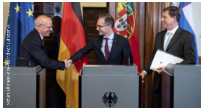
Die EU-Ratspräsidentschaft 2020/21: Die Außenminister Portugals (1. Halbjahr 2021), Deutschlands (2. Halbjahr 2020) und Sloweniens (2. Halbjahr 2021) veranstalten im Mai 2019 in Berlin eine gemeinsame Pressekonferenz.

Um all diese verschiedenen Verhandlungen zu leiten und zu organisieren, hat der Rat jeweils für sechs Monate einen rotierenden Vorsitz. Die Reihenfolge wird gemäß Art. 236 des Vertrags über die Arbeitsweise der EU (AEUV) vom Europäischen Rat festgelegt. Um eine längerfristige Planung zu ermöglichen, bilden jeweils drei Ratspräsidentschaften gemeinsam ein „Trio“, in dem sie ihre Prioritäten abstimmen. Grundsätzlich soll an jedem Trio mindestens ein größerer EU-Staat teilneh-