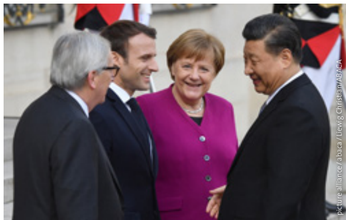
Am 26. März empfangen Emmanuel Macron und Angela Merkel gemeinsam mit Jean-Claude Juncker Chinas Staatspräsidenten Xi Jinping in Paris. Die Beziehungen der EU zu China werden die deutsche EU-Ratspräsidentschaft genauso beschäftigen wie die künftigen Beziehungen zu Großbritannien. Die Unterhändler Michel Barnier (EU, re.) und David Frost am 2. März 2020 in Brüssel