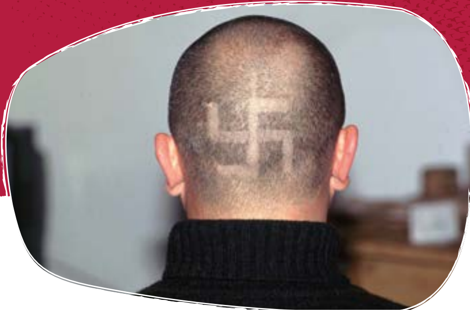
Skinhead mit einrasiertem Hakenkreuz

mit denen ein Verbot umgangen wird. So werden beispielsweise Runen, Ziffern und Buchstaben verwendet, um die Zugehörigkeit zur rechtsextremen Szene zu symbolisieren.