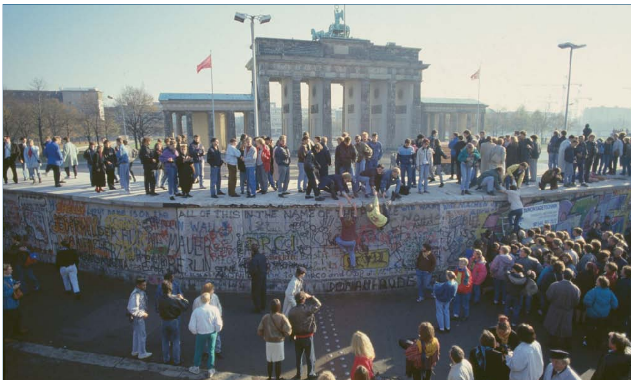
Berliner besetzen die Mauer nach Öffnung der Grenze 1989

Häufig werden in der Gedenktagpraxis mögliche Verbindungslinien nicht gezogen. So bleibt das – nicht nur didaktische – Potenzial eines Gedenk- oder Jahrestags unausgeschöpft. Gerade für den 9. November, an dem Deutschlands Möglichkeiten „zum Guten und zum Bösen“ (Thomas Mann) gleichermaßen aufscheinen, sollten diese tatsächlich ins Bewusstsein rücken. Der 9. November ist eben mehr als ein Tag der Schande und der Warnung. Er ist mehr als ein Tag, der einlädt, sich mit den Opfern menschenverachtender Ideologien und Herrschaftspraktiken zu solidarisieren und ihrer zu gedenken. Er ist ein Tag