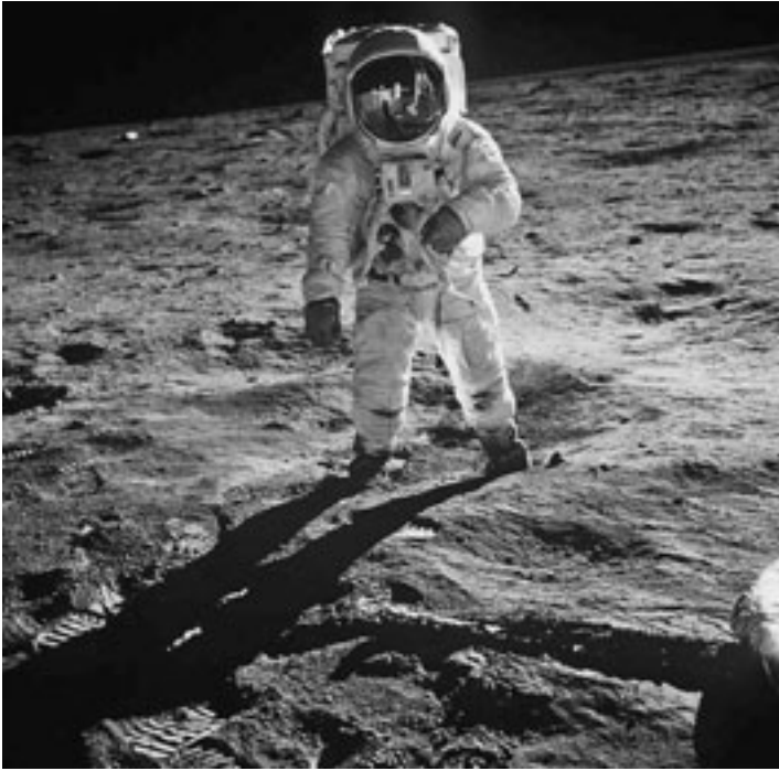
20. Juli 1969. »Buzz« Aldrin auf dem Mond. Ich war zehn und dabei.

fortschrieb, dass man selbst ein Teil dieser unablässigen Erweiterung des Machbarkeits- und Erwartungshorizontes wurde. Auch auf diese Weise wurde die expansive Kultur der Moderne Teil unserer mentalen Innenausstattung (bei den Mädchen sah es wahrscheinlich ein wenig anders aus, aber ein anderes Verhältnis zu Gegenwart und Zukunft hat das bei denen auch nicht bewirkt).