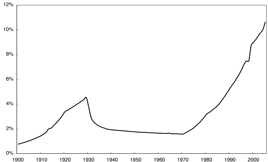
Abb. 1: Mexikanische Emigranten in den USA als Prozentsatz der mexikanischen Bevölkerung 1900-2005

Quelle: Datei 2002 des Mexikanischen Migrationsprojekts NATLHIST ( http://mmp.opr.princeton.edu ), CONAPO 2006, eigene Berechnungen