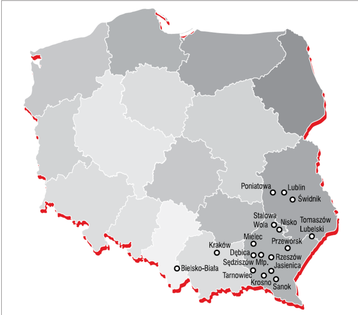
Grafik 4: »Aviation Valley« (Dolina Lotnicza)