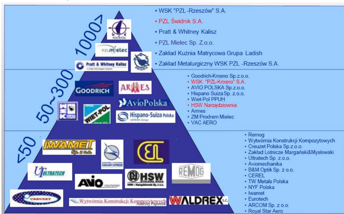
Grafik 1: Betriebsgrößenstruktur der Unternehmen im »Aviation Valley«