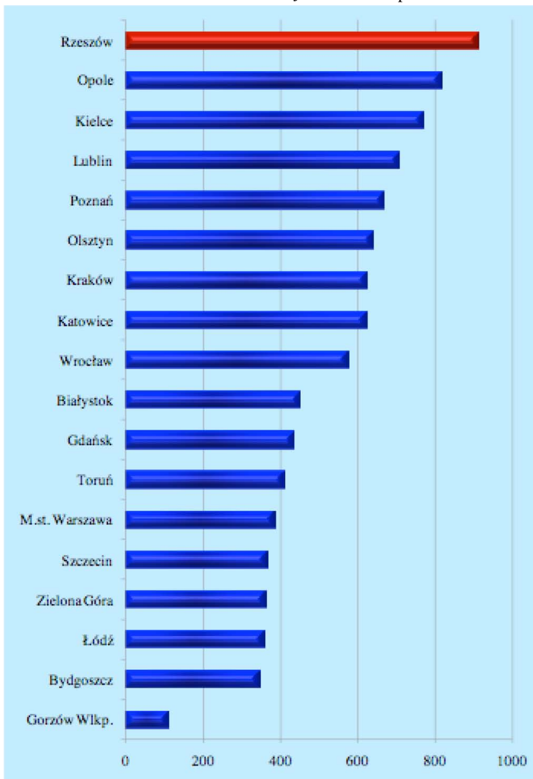
Grafik 3: Hochschulabsolventen im akademischen Jahr 2010/2011 pro 10.000 Einwohner

Opole (Oppeln), Poznań (Posen), Olsztyn (Allenstein), Kraków (Krakau), Katowice (Kattowitz), Wrocław (Breslau), Gdańsk (Danzig), Toruń (Thorn), M.st. Warszawa (Stadt Warschau), Szczecin (Stettin), Zielona Góra (Grünberg), Łódź (Lodsch), Bydgoszcz (Bromberg), Gorzów Wielkopolski (Landsberg an der Warthe)