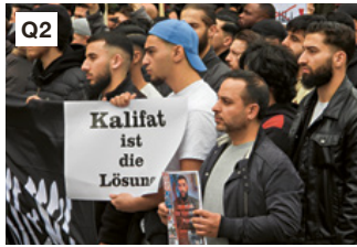
Q2 Demonstration im April 2024 in Hamburg