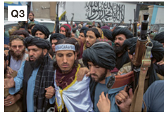
Q3 Feier von Taliban-Kämpfern im August 2022 in Afghanistan