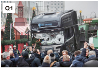
Q1 Berliner Breitscheidplatz am 19. Dezember 2016