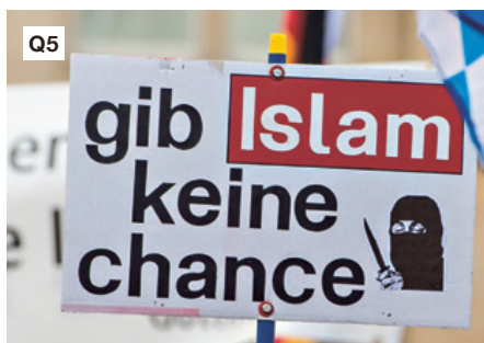
Pegida-Demonstration 2015 in Dresden

4 Wenn zwei Begriffe ähnlich klingen, kommt es vor, dass sie miteinander verwechselt werden – sei es mit böser Absicht oder schlicht aus Unwissenheit.