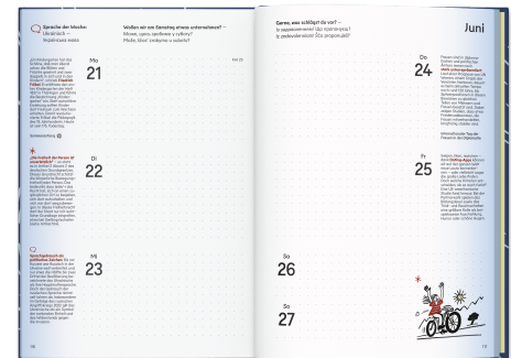
Hardcover „Wind“ Bestell-Nr. 2549 A