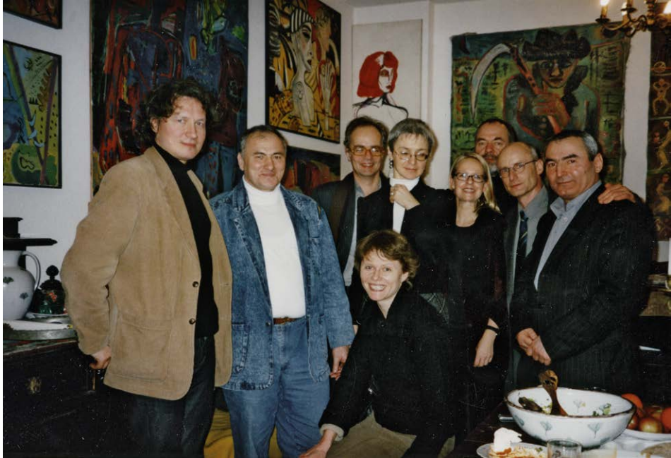
Anna Politkowskaja (Bildmitte, mit erhobener Hand)

Auf Deutsch erschienen Tschetschenien. Die Wahrheit über den Krieg , 2003, In Putins Russland , 2005, Russisches Tagebuch , 2007.