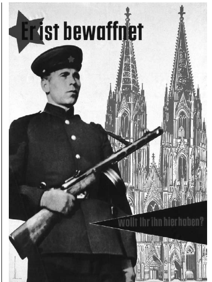
— Abb.: Plakat der CDU aus dem Jahr 1953

Adenauer konnte für seine Politik in freien Wahlen Mehrheiten bei den Westdeutschen gewinnen. Bei der Bundestagswahl am 6.9.1953 erhielten diejenigen Parteien eine ¾ Mehrheit, die seinen Kurs der Westintegration und der Wiederbewaffnung unterstützten.