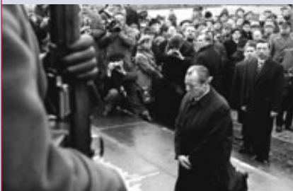
1. BITTE UM VERGEBUNG (Willy Brandts Kniefall am Mahnmal des Warschauer Ghettos 1970)

Primo Levi (ital. Schriftsteller, 1919 – 1987)