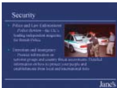
Aus der Selbstdarstellung der Jane's Information Group

Jane's gibt eine Anzahl von Fachzeitschriften wie „Jane's Defence Weekly“ oder „Jane's Intelligence Weekly“ und laufend Spezialpublikationen zu Sicherheitsthemen vom „Chemo-Bio-Handbook“ bis zum „Unconventional Weapons Response Handbook“ heraus, sowie zahlreiche Länderberichte und Sicherheitsanalysen. Vor allem aber bietet Jane's Dutzende brisanter Datenbanken an, etwa über World Insurgency and Terrorism, über strategische Waffensysteme oder nicht-tödliche Waffen. Premium-Produkt ist der personalisierte Nachrichtendienst Inner Circle, der in der Online-Version um US$ 6.795 Subskriptionsgebühr pro Jahr zu haben ist. Die Informationen, die von Jane's angeboten werden, sind teuer. Aber zu den Kunden zählen ja nicht idealistische Kulturvereine und Bürgerrechtsgruppen, sondern die Verwalter des globalen Status quo.