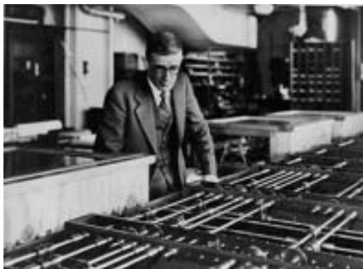
Vannevar Bush (1890–1974)

In der Formulierung der Geopolitik der Nachkriegszeit hatte Henry A. Kissinger eine signifikante Funktion. Kissinger wurde zuerst als Leiter des National Security Council unter Nixon zu dessen Berater für Angelegenheiten der nationalen Sicherheit und avancierte 1973 zum Außenminister. Vor allem in den 1960er und 1970er Jahren spielte er eine tragende Rolle in der Formulierung der US-Außenpolitik und war somit ein maßgeblicher Gestalter der damaligen Weltpolitik. Mit Richard Nixon kam es ab 1969 zu einem Wechsel in der US-Außenpolitik, und gemeinsam mit Kissinger entwickelte er ein Konzept einer Entspannungspolitik, die auf dem Gleichgewicht der drei wichtigsten Weltmächte USA, UdSSR und Volksrepublik China beruhte. Wie mittlerweile ausreichend bekannt ist, schreckte Kissinger bei seinen geostrategischen Plänen auch nicht vor Gewalt zurück: er war maßgeblich an der Planung des US-Bombardements von Kambodscha beteiligt und unterstützte autoritäre Machthaber wie den Schah im Iran und Augusto Pinochet in Chile. Der gewaltsame Sturz des chilenischen Präsidenten Salvador Allende, der zur Machtergreifung Pinochets führte, erfolgte unter der Oberaufsicht Kissingers. In den letzten Jahren gab es vielfach Anstrengungen, Kissinger wegen seiner Verstrickungen gerichtlich zu belangen. In einem Interview hat der Friedensforscher Johan Galtung ihn wegen seiner Rolle beim Sturz Allendes gar mit dem berühmtesten Terroristen der Welt verglichen: „Kissinger ist der Bin Laden Chiles“ 92 .