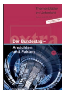
Der Bundestag – Ansichten und Fakten (Nr. 20)