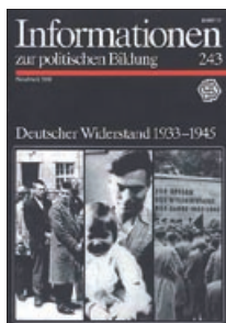
Informationen zur politischen Bildung (Nr. 243: Deutscher Widerstand 1933–1945)