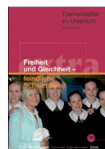
Freiheit und Gleichheit – feindliche Schwestern? (Nr. 40)