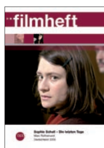
Filmheft (Sophie Scholl – Die letzten Tage)