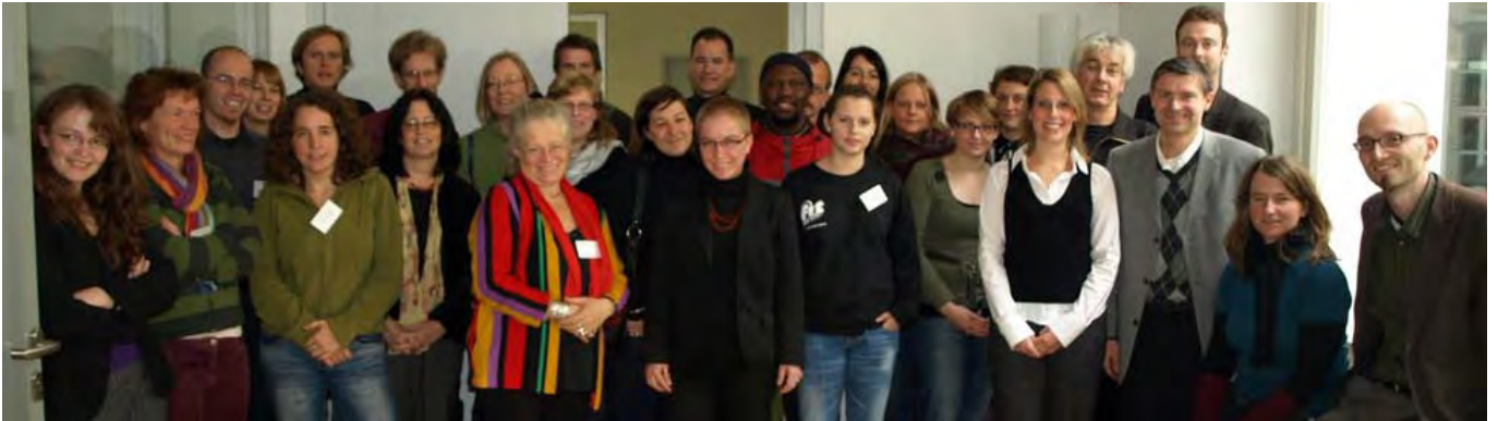
Teilnehmende des ersten Didaktik-Dialogs in den Räumen der Hertie School of Governance in Berlin

Erfahrungen und Perspektiven des Peer Group-Ansatzes in der Bildungsarbeit