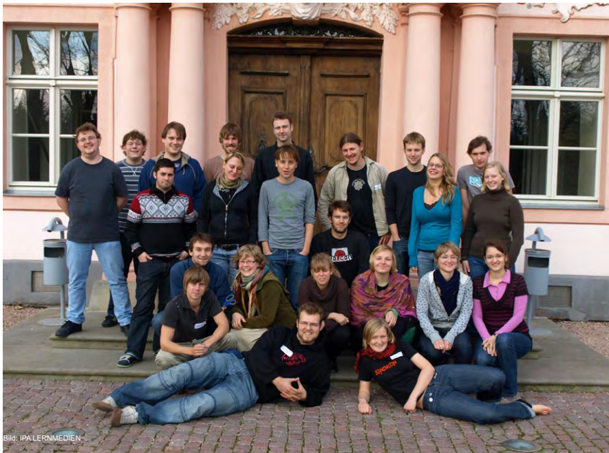
Die Teilnehmer/innen des Ausbildungsworkshops vor dem Schloss Oppurg. Mehr über vertrauensbildende Maßnahmen und das herbstliche Wochenende in Oppurg in der Workshopdokumentation .

Wie kann Vertrauen in einer global verflochtenen Weltwirtschaft aufgebaut und bewahrt werden?