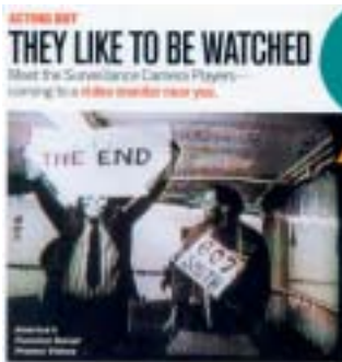
Surveillance Camera Players in Aktion

Aktivismus im Netz kann viele Formen annehmen, aber keine davon setzt gewaltsame oder kriminelle Handlungsweisen ein. So konzentrieren sich die Aktivisten beispielsweise darauf, wie McSpotlight Hintergrundinformationen über Geschäftspraktiken zur Verfügung zu stellen, oder sie versuchen, breite Unterstützung gegen einen Gesetzesvorschlag zu erhalten, wie z. B. die Blue Ribbon Campaign der Electronic Frontier Foundation. 71 Dabei sollte durch das Platzieren eines digitalen Bildes – der nun berühmten blauen Bänder, die in Anlehnung an die roten AIDS-Schleifen geschaffen wurden – auf Websites Widerstand gegen den US Communications Decency Act 72 signalisiert werden. Künstlergruppen wie RTMark imitieren Websites von Organisationen und Personen, und Aktivistengruppen wie die Surveillance Camera Players machen durch Aufführungen vor Überwachungskameras auf die zunehmende Kontrolle öffentlicher Plätze aufmerksam.