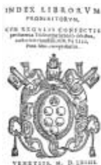
„Verzeichnis der verbotenen Bücher“ der katholischen Kirche (1564)

In Europa war die katholische Kirche jahrhundertlang die maßgebliche Wahrheitsinstanz. Dementsprechend findet man in ihrem Umkreis die ersten zielgerichteten Zensurprojekte. So hat etwa das Konzil von Paris (1210) die Behandlung mancher Schriften des Aristoteles in der Lehre wegen ihrer materialistischen Tendenzen verboten. Im 16. Jahrhundert, kurze Zeit nach der Erfindung des Buchdrucks, die Bücher auch Menschen außerhalb der von der Kirche kontrollierten Gesellschaftsbereiche zugänglich machte, publizierte die katholische Kirche eine schwarze Liste von Werken, die nicht gelesen werden durften: den Index librorum prohibitorum . Neben den Luther-Bibeln und anderen religiösen Schriften nannte das Dokument Hunderte von Autoren, deren Ideen als subversiv galten. Der Index wurde erst vom Zweiten vatikanischen Konzil (1962–1965) abgeschafft.