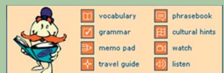
Abb. 2: Online-Hilfen zu den Aufgaben