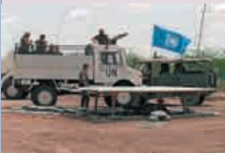
Deutsche UN-Soldaten in Somalia

Soldaten der Bundeswehr sind mit unterschiedlichen Aufträgen im Ausland tätig, z.B. im Kosovo.