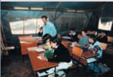
Klassenzimmer in Bare/Mitrovica; Foto: Örk

Friedensgruppen und Organisationen helfen mit Geld oder persönlichen Kontakten in Krisengebieten. Auch Schülergruppen engagieren sich, z.B. beim Wiederaufbau von Schulen in Kriegsgebieten.