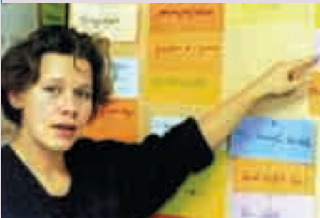
Friedensfachkraft beim Albanisch-Kurs; Foto: epd

Angesichts der Konflikte und Kriege in der Welt sind viele Menschen bereit, sich persönlich auf unterschiedliche Weise direkt für eine friedlichere Welt einzusetzen. Wie könnten Sie sich persönliches Engagement heute, wie später vorstellen? Wie bewerten Sie die hier aufgeführten unterschiedlichen Ansätze für die Konfliktbearbeitung?