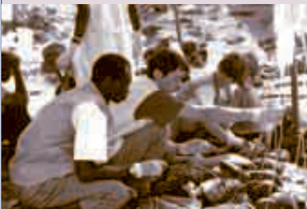
Notärzte in Zaire; Foto: epd

Not- und Katastrophendienste sind weltweit tätig.