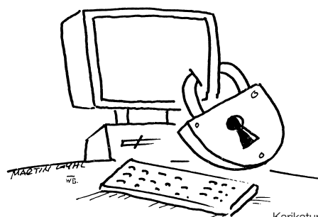
Karikatur: Martin Guhl

Ein Thema, das im Unterricht direkt anschließen könnte, wäre der Bereich „Internet und Datenschutz“.