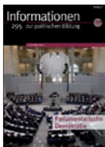
Parlamentarische Demokratie (Nr. 295)