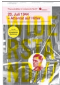
20. Juli 1944 – Attentat auf Hitler (Nr. 37)