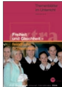
Freiheit und Gleichheit – feindliche Schwestern? (Nr. 40)