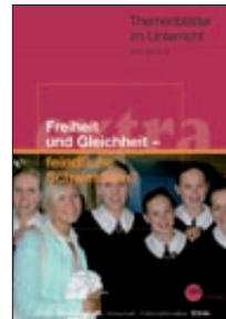
Freiheit und Gleichheit – feindliche Schwestern? (Nr. 40)