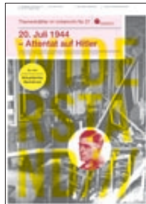
20. Juli 1944 – Attentat auf Hitler (Nr. 37)