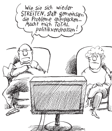
„Etatdebatte gestern — Etatdebatte heute“

Methodische Hinweise zur Pro-Contra-Diskussion finden Sie im nebenstehenden Tipp-Kasten.