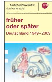
„früher oder später“ – das Kartenspiel zu pocket zeitgeschichte Autor: Bernhard Weber (Bestell-Nr. 1.921)