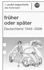
– das Kartenspiel zu pocket zeitgeschichte Autor: Bernhard Weber (Bestell-Nr. 1.921)