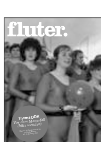
Thema DDR (Nr. 30)