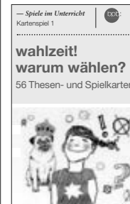
wahlzeit! warum wählen? – Kartenspiele im Unterricht (Bestell-Nr. 1.922) 1.-Euro

56 liebevoll illustrierte Thesenkarten, mit denen man Quartett oder Schwarzer Peter spielen, aber auch heftige Gruppendiskussionen auslösen kann.