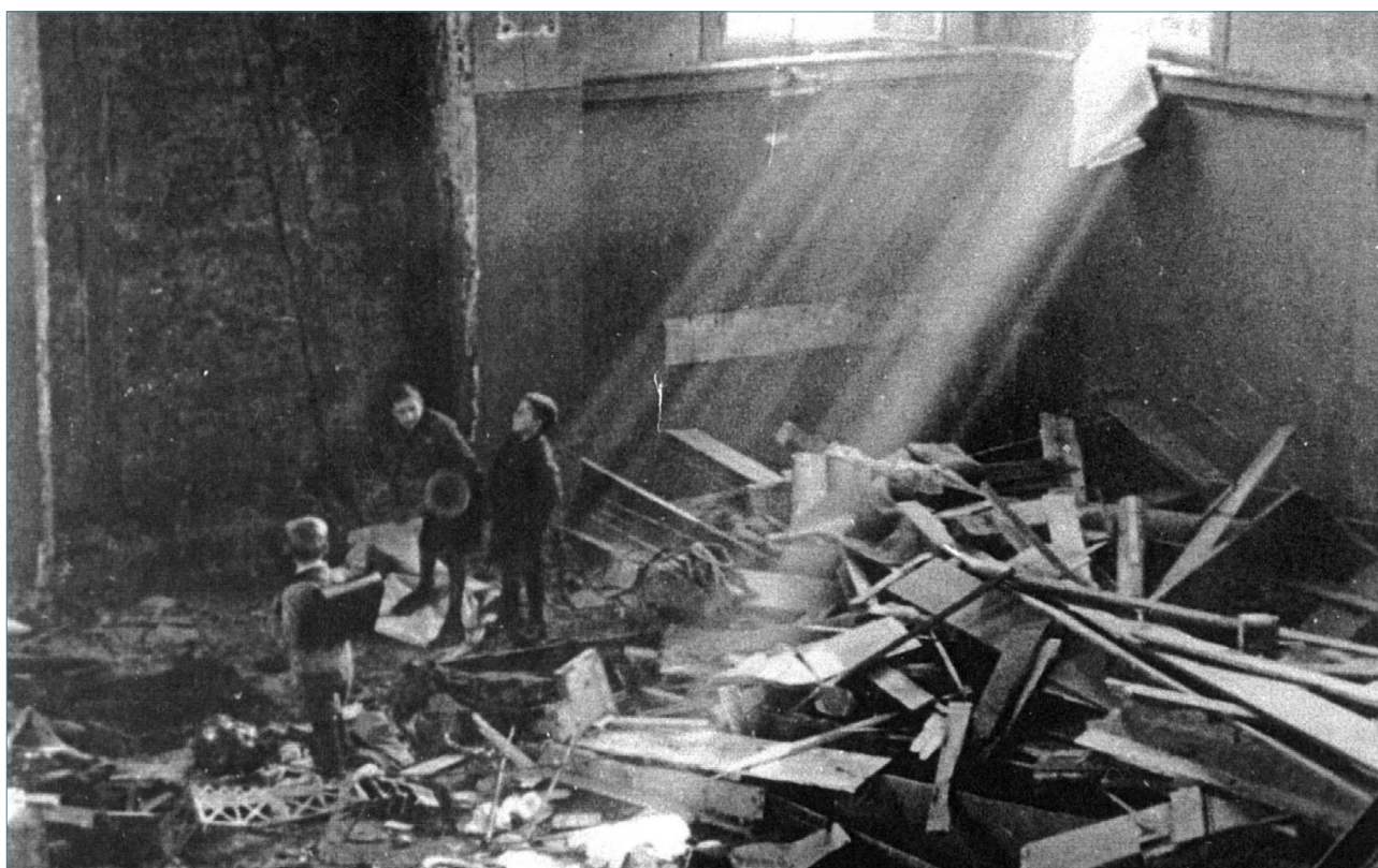
Kinder in der zerstörten Synagoge von Königsbach (10. November 1938)