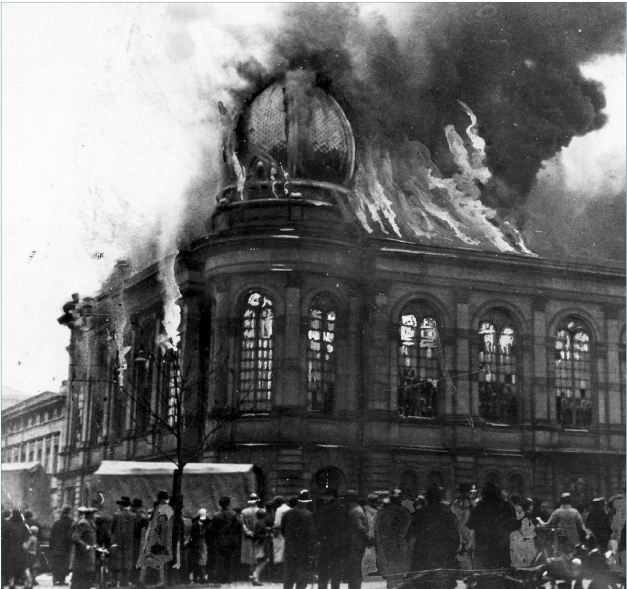
Die brennende Synagoge Frankfurt/Main am 10. November 1938

nacht“ bzw. seine Verwendung ausschließlich in Anführungszeichen ist nicht etwa nur der politischen Korrektheit geschuldet, sondern kann inhaltlich begründet werden: Zum einen war die „Aktion“ nicht allein auf eine Nacht beschränkt und zum anderen gingen nicht nur ein paar Fenster- oder Schaufensterscheiben zu Bruch. So kam es in Nordhessen schon am 7. November zu ersten Ausschreitungen und auch die Bilder der zerstörten Synagogen sprechen für sich.