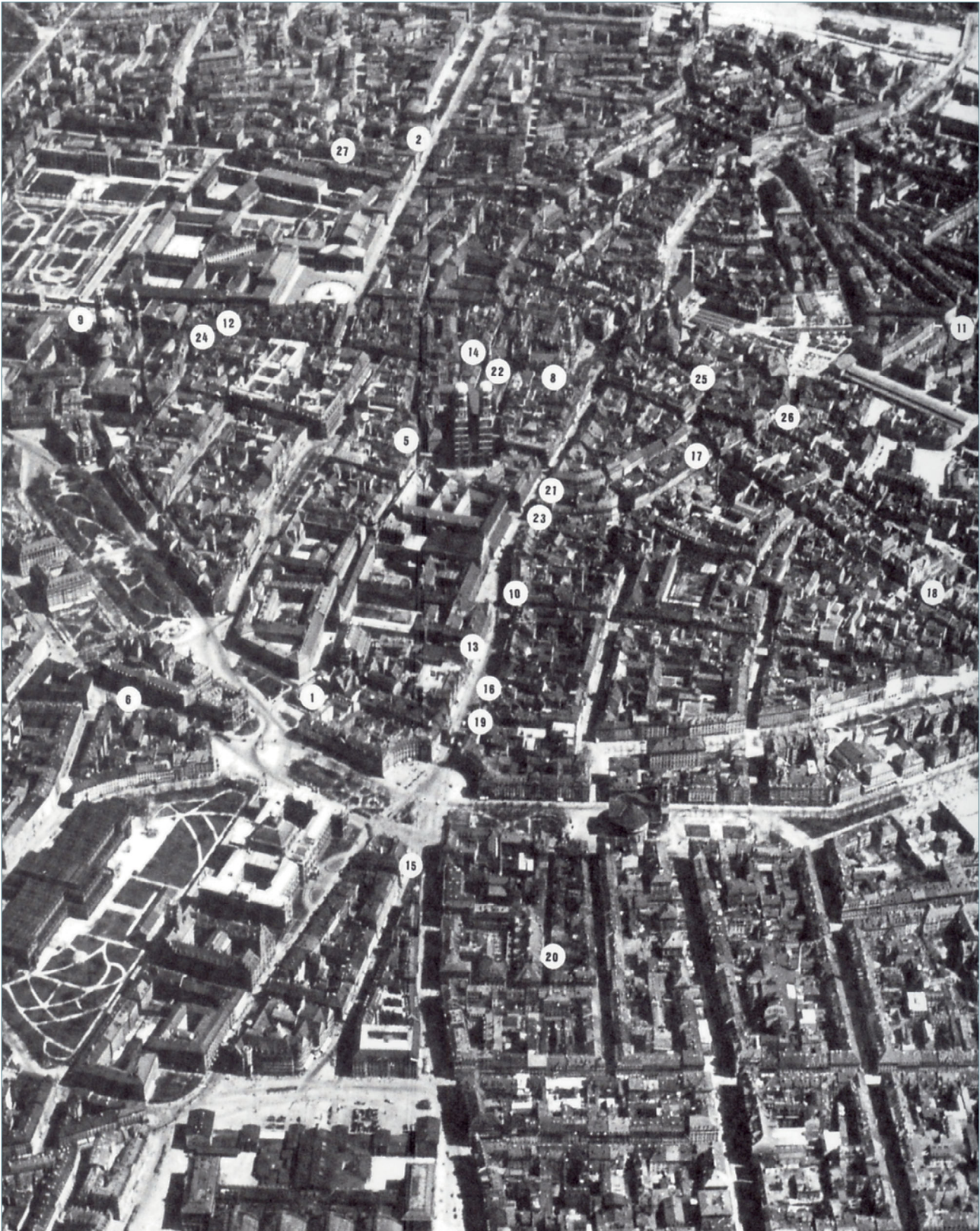
Andreas Heusler/Tobias Weger: „Kristallnacht“. Gewalt gegen die Münchner Juden im November 1938. München: MünchenVerlag GmbH, 1998, Schutzumschlag