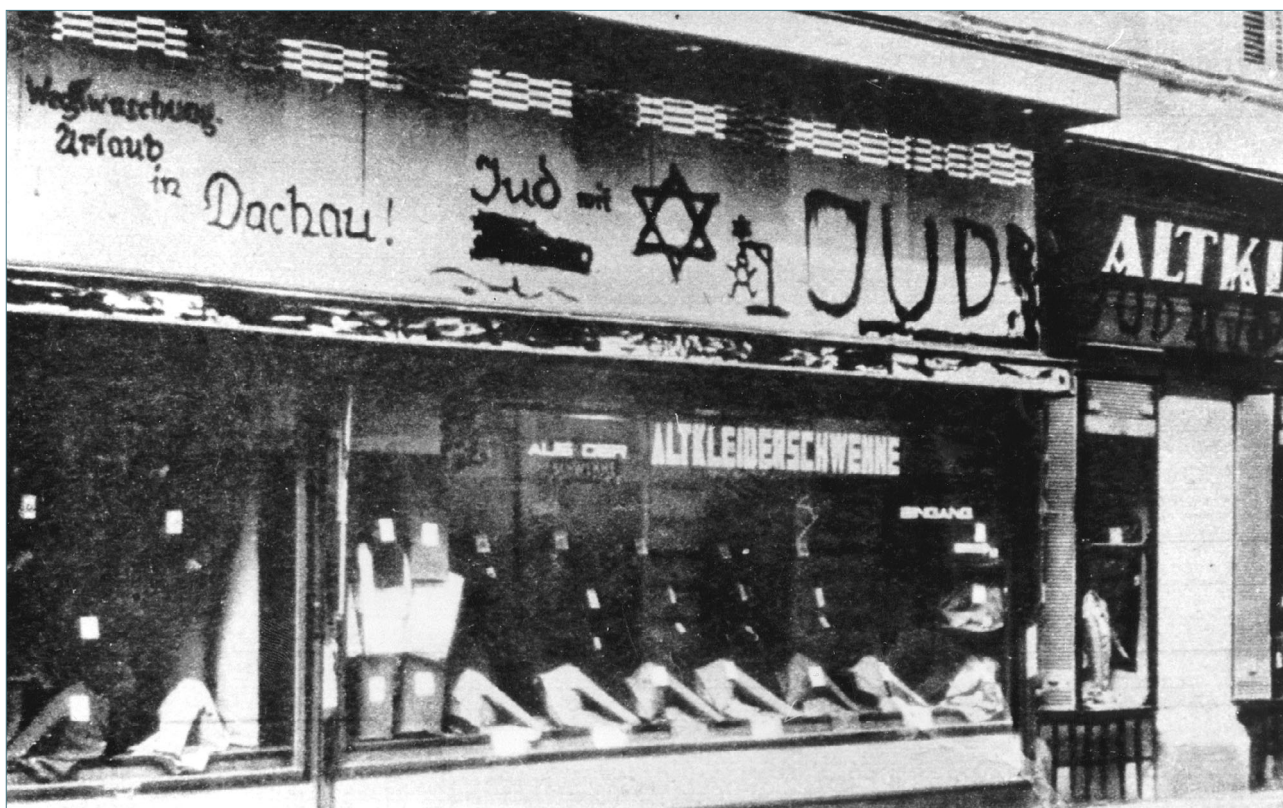
Antisemitische Schmierereien am 9. November 1938 in München.