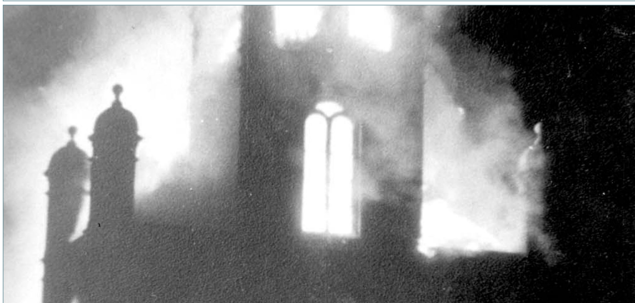
Die brennende Synagoge von Groß-Gerau (9. November 1938).