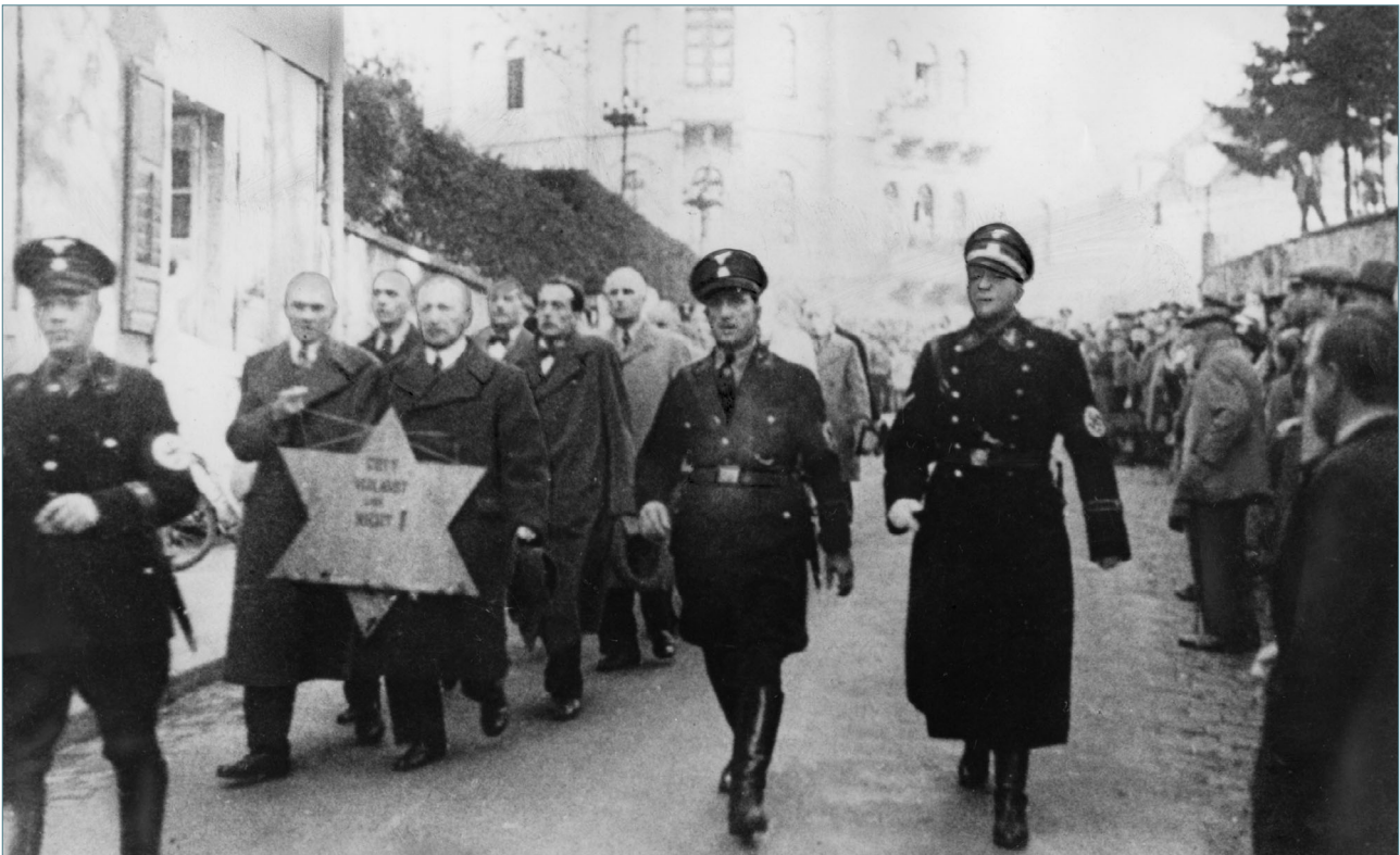
Gefangennahme jüdischer Männer in Baden-Baden (9. November 1938)