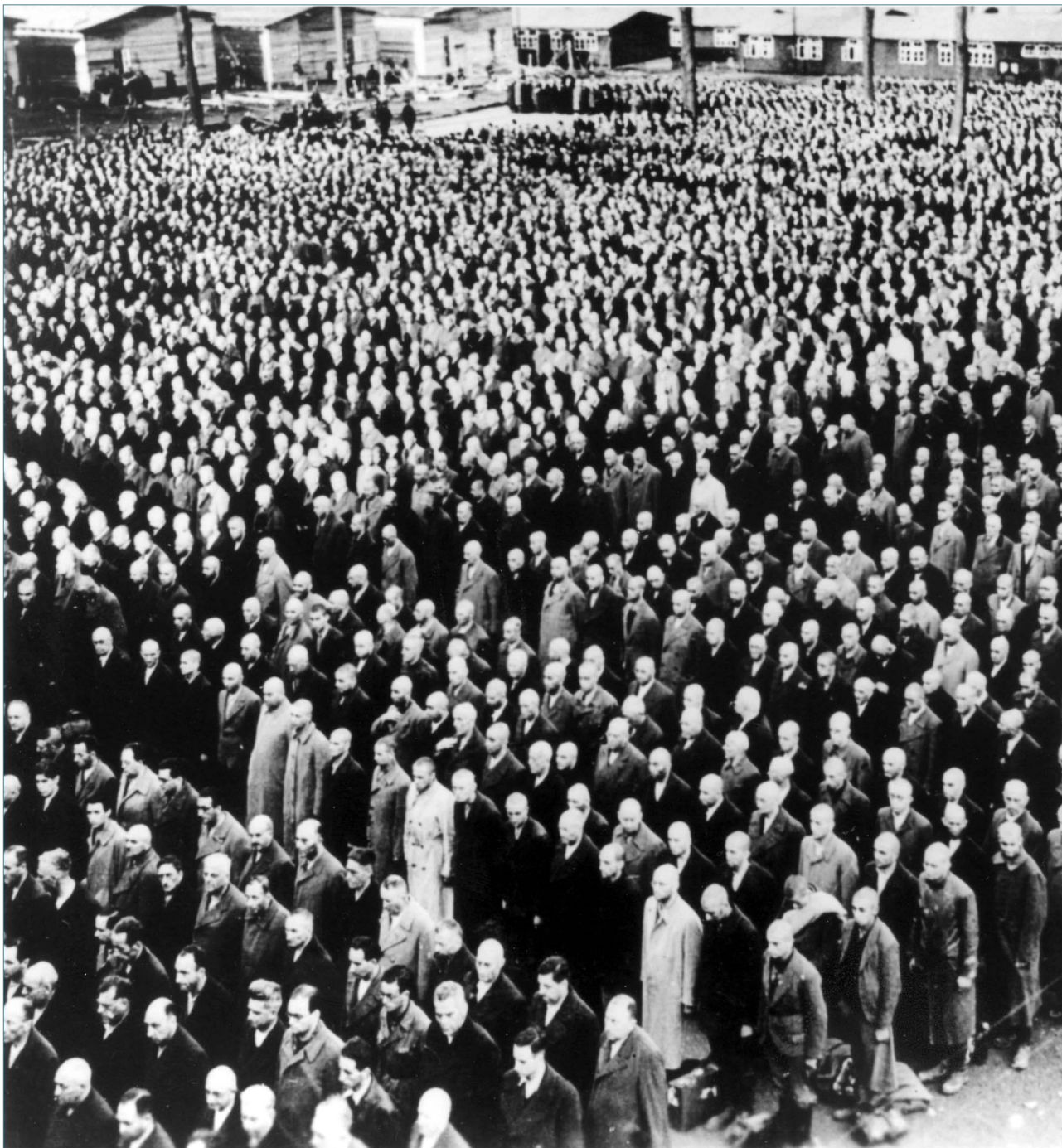
Konzentrationslager Buchenwald (Thüringen), November 1938. Inhaftierte jüdische Männer, die seit dem 10. November 1938 festgenommen und nach Buchenwald verschleppt worden sind.