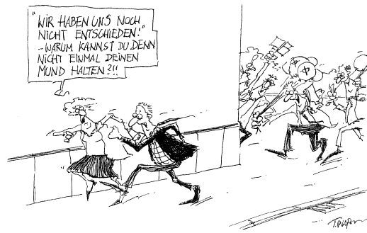
Karikatur: Thomas Plafßmann

■ Seite B ■ ist problemorientiert. Sie fordert zur Auseinandersetzung mit Fragen auf, die sich in unserer Mediengesellschaft im Zusammenhang mit Wahlen stellen.